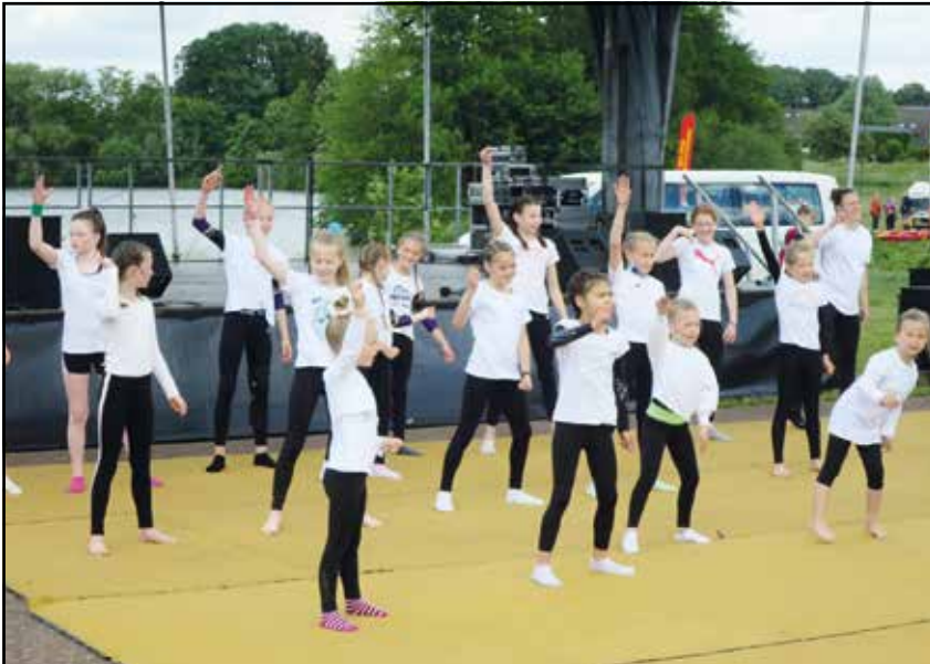
Turnen in der Gruppe