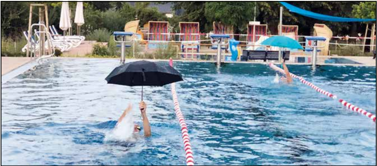
Training einmal anders: Juxstaffeln Rückenschwimmen mit Regenschirmen