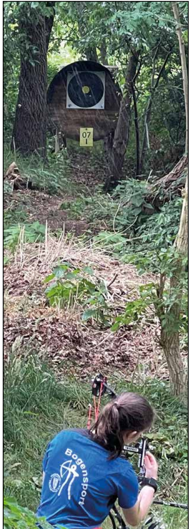
Landesmeisterschaft in Berge