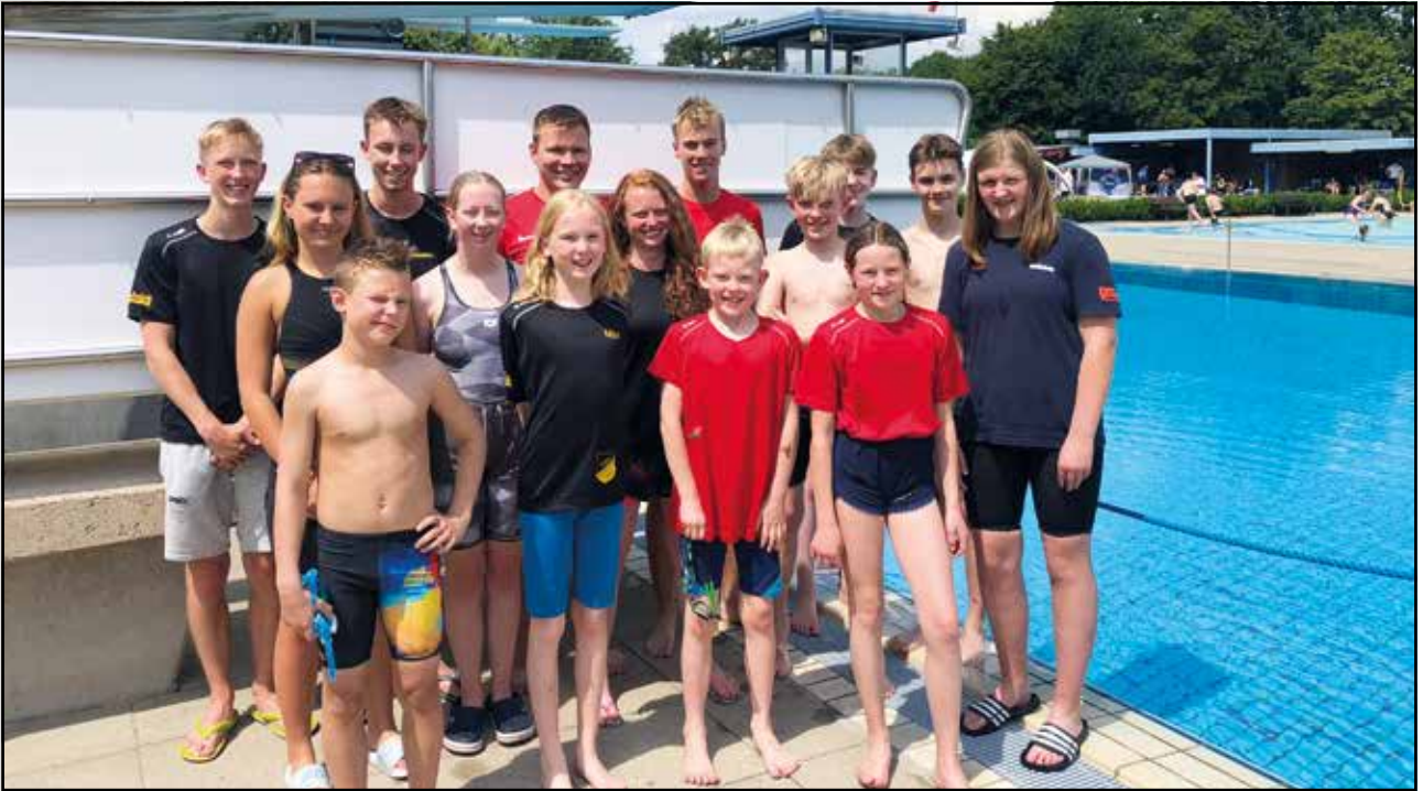
Die Teilnehmer der Trainingsgemeinschaft im Freibad Quakenbrück