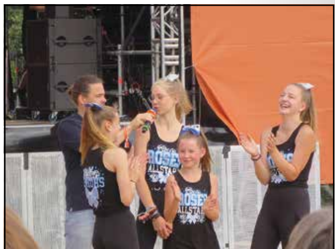
... und gar nicht schüchtern beim Radio-Interview