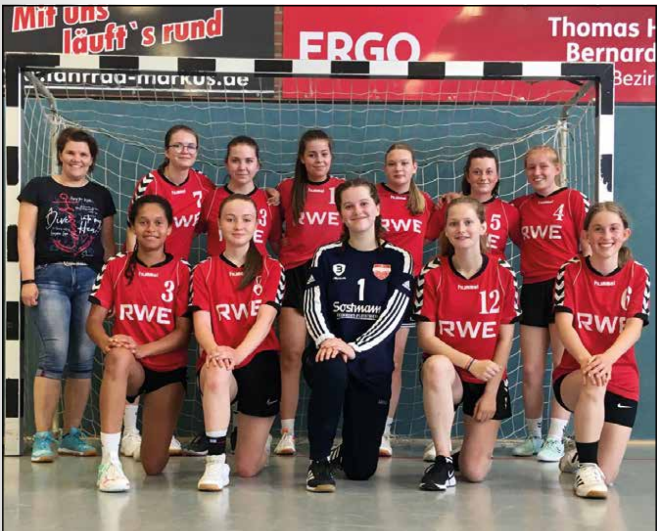
Unsere weibliche Jugend B

Die weiteren Gegner in der Vorrunde sind die Teams aus Damme sowie aus Bohmte. Im Vordergrund sollen