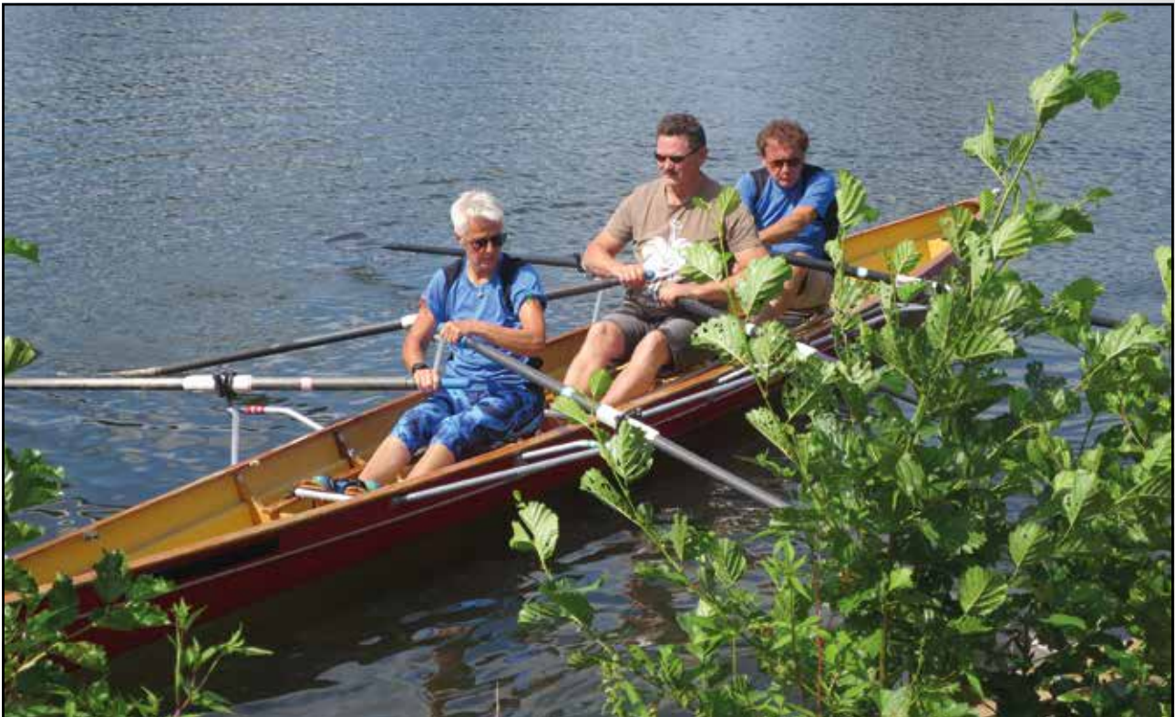
... mit Anfängern und Routiniers im Boot beim NDR-Event