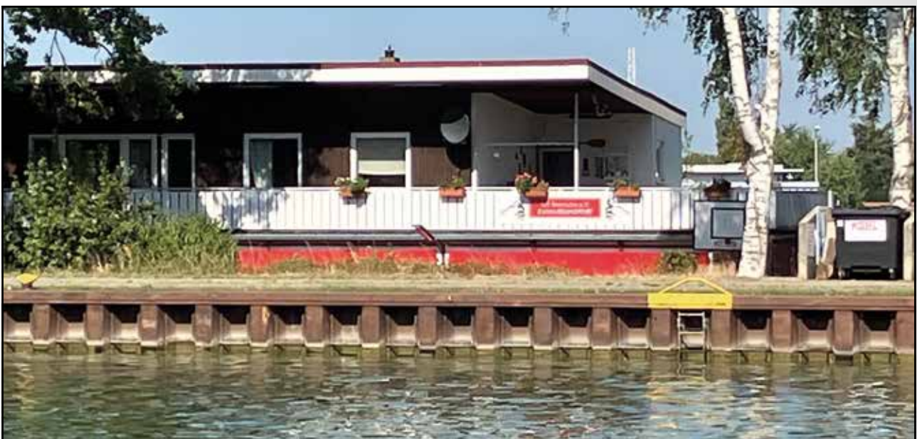
Das Kanubootshaus des TuS am Mittellandkanal