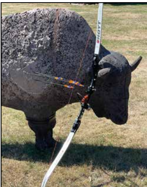
3D-Training auf unserem Schießplatz