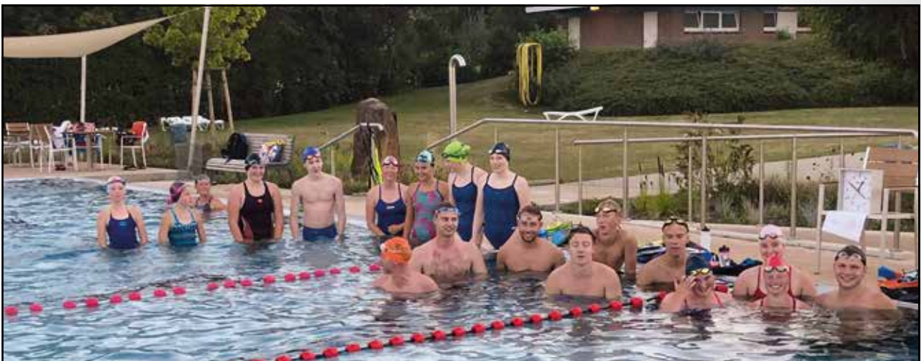
Volle Bahnen beim Freibadtraining in den Ferien in Ueffeln