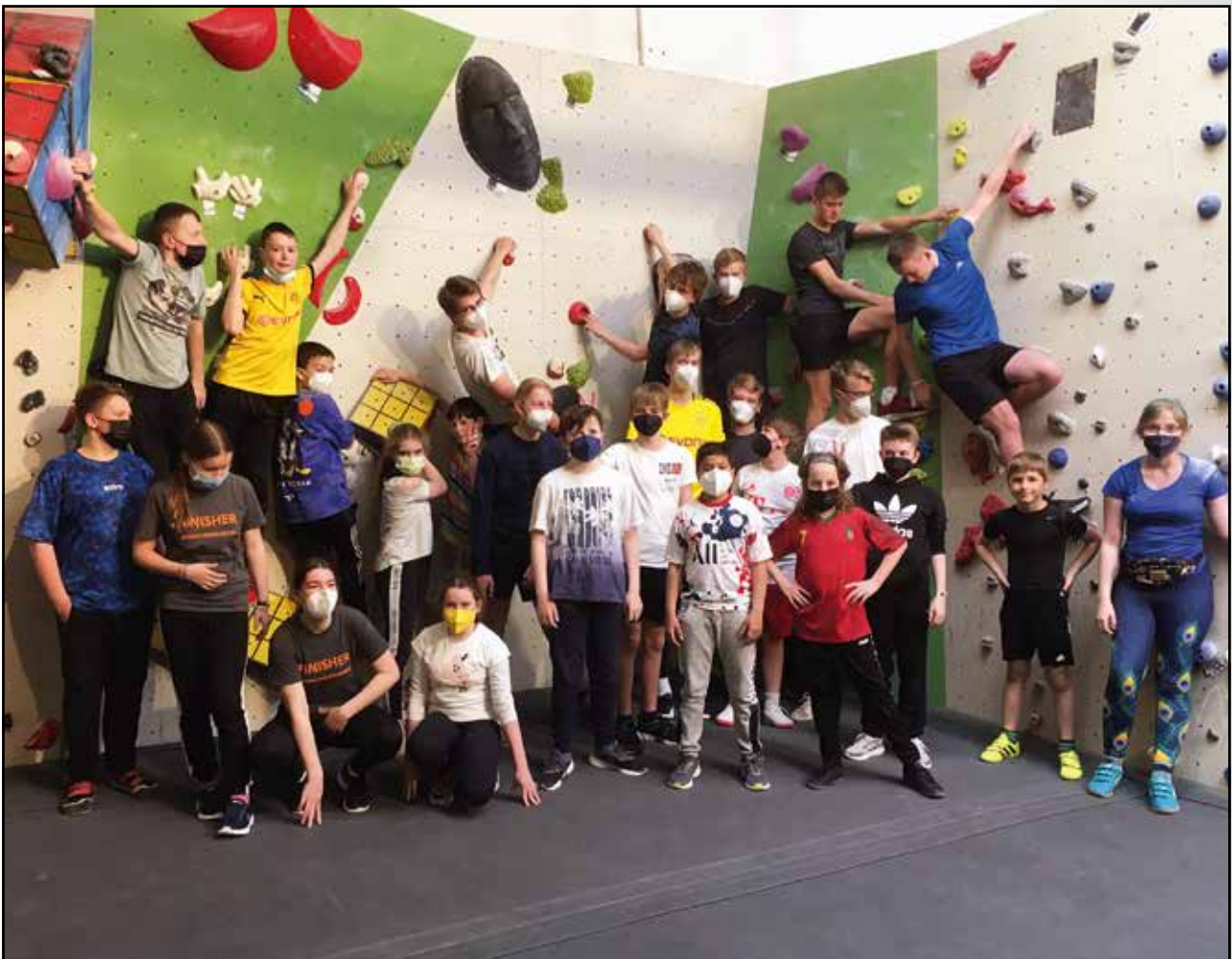
Die Schüler-Rudergruppe in der Boulder-Halle in Osnabrück