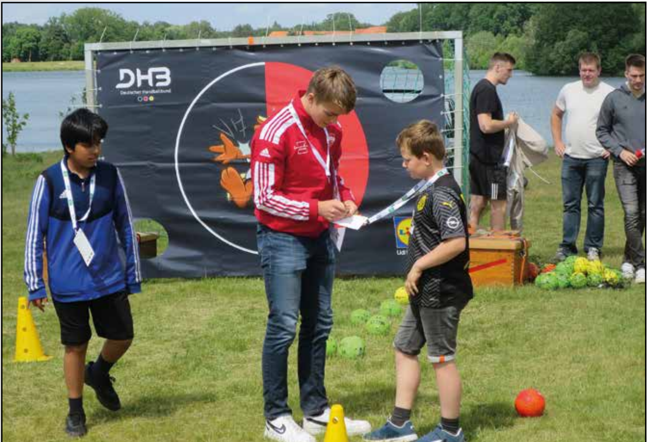
Station der Handballabteilung und