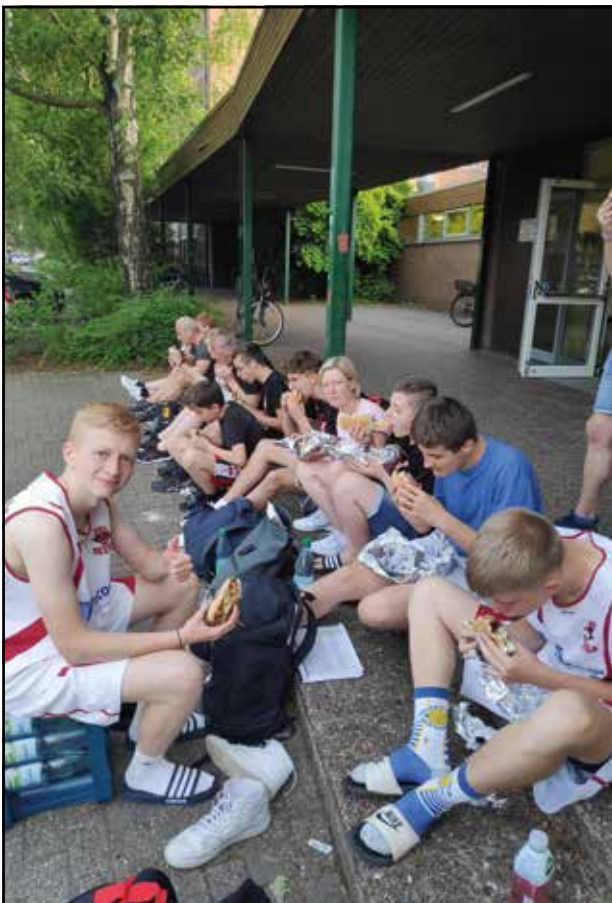
... und eine verdiente Pause