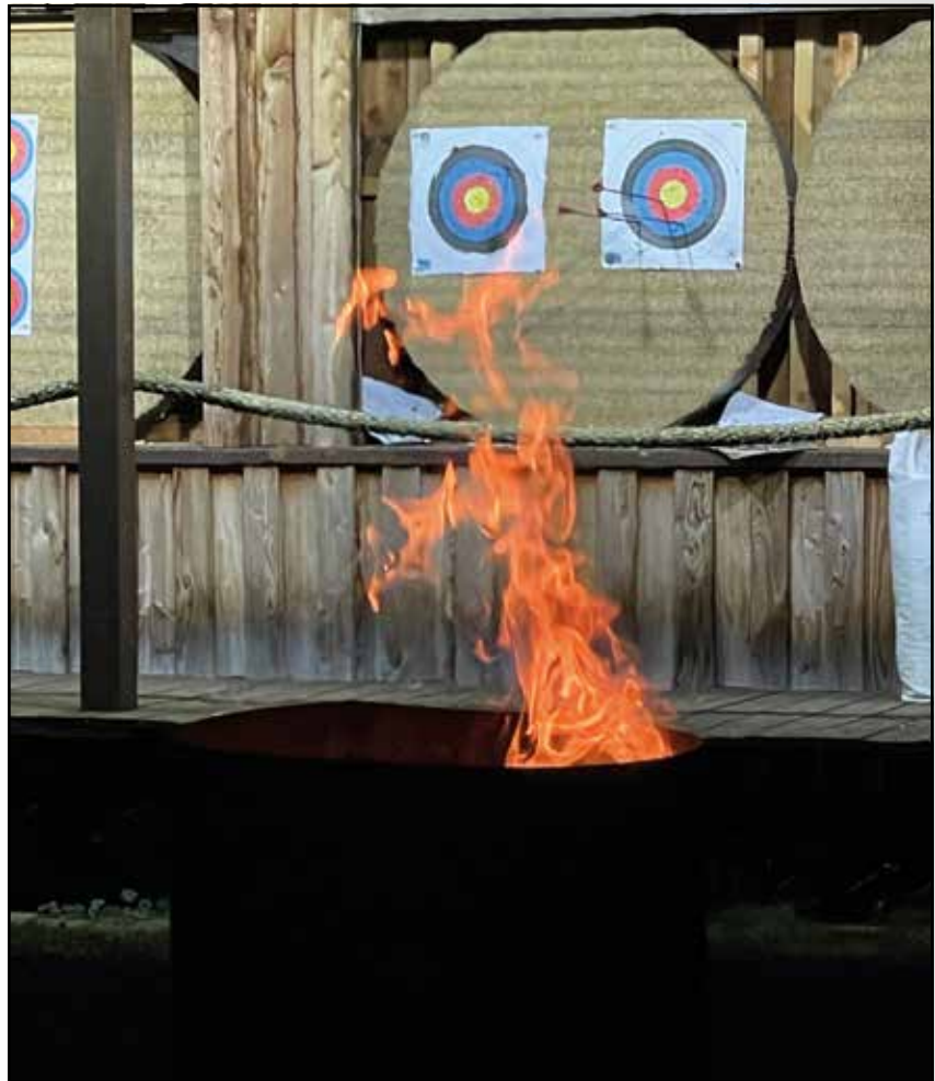
Nachtschießen mit Lagerfeuer

In dieser Saison konnten wir aufgrund des fast durchgehend perfekten Wetters oft und gut trainieren und manchmal auch Abende mit Nachtschießen, Grillwurst und Darts verbringen.