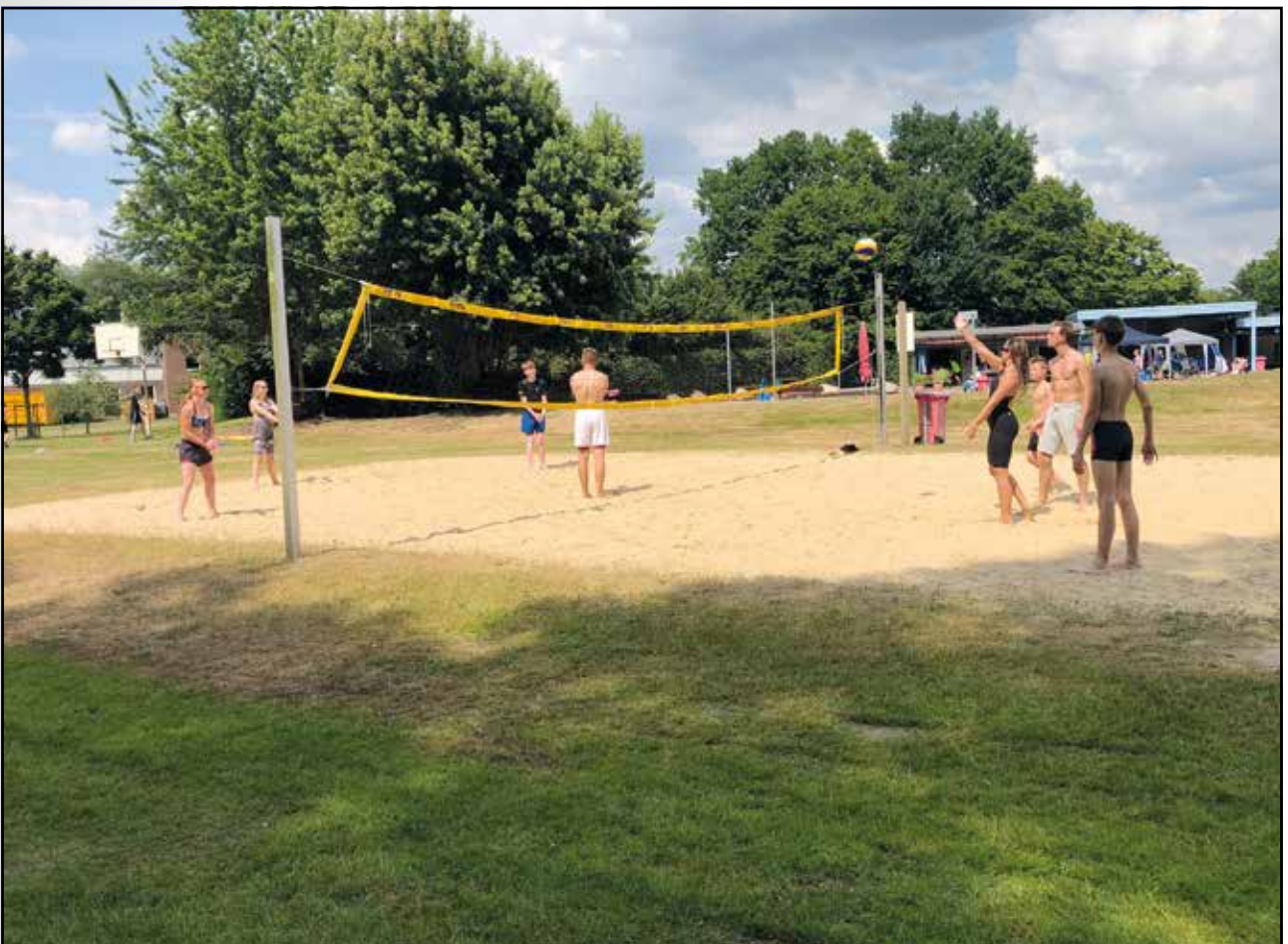
In der langen Mittagspause wurde auch anderer Sport betrieben