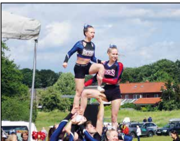
... mit vielen Figuren