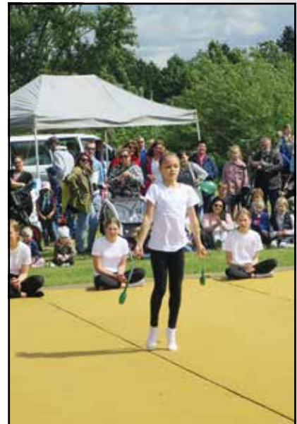
... und mutig allein auf der Fläche