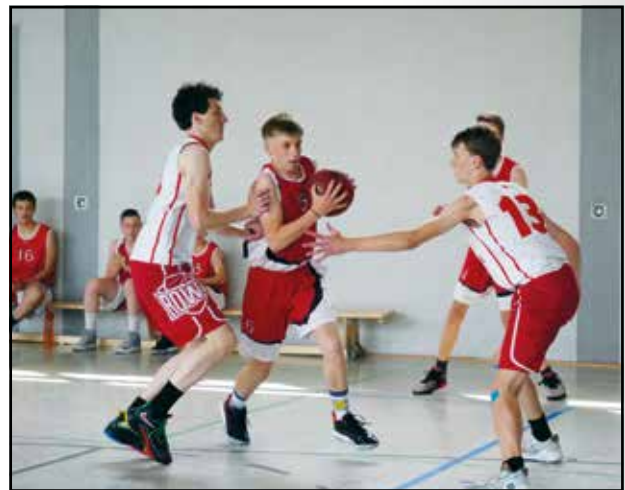
Angriff und Verteidigung ...