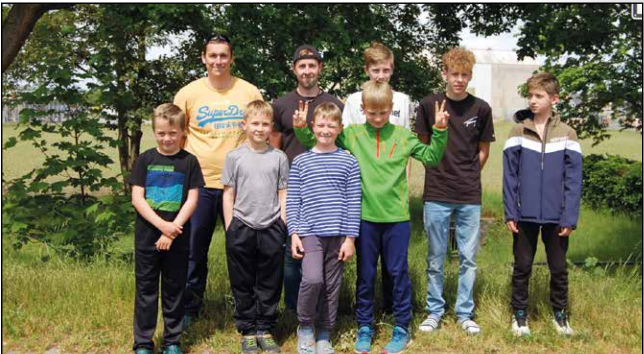
Unser Regatta-Team in Hannover