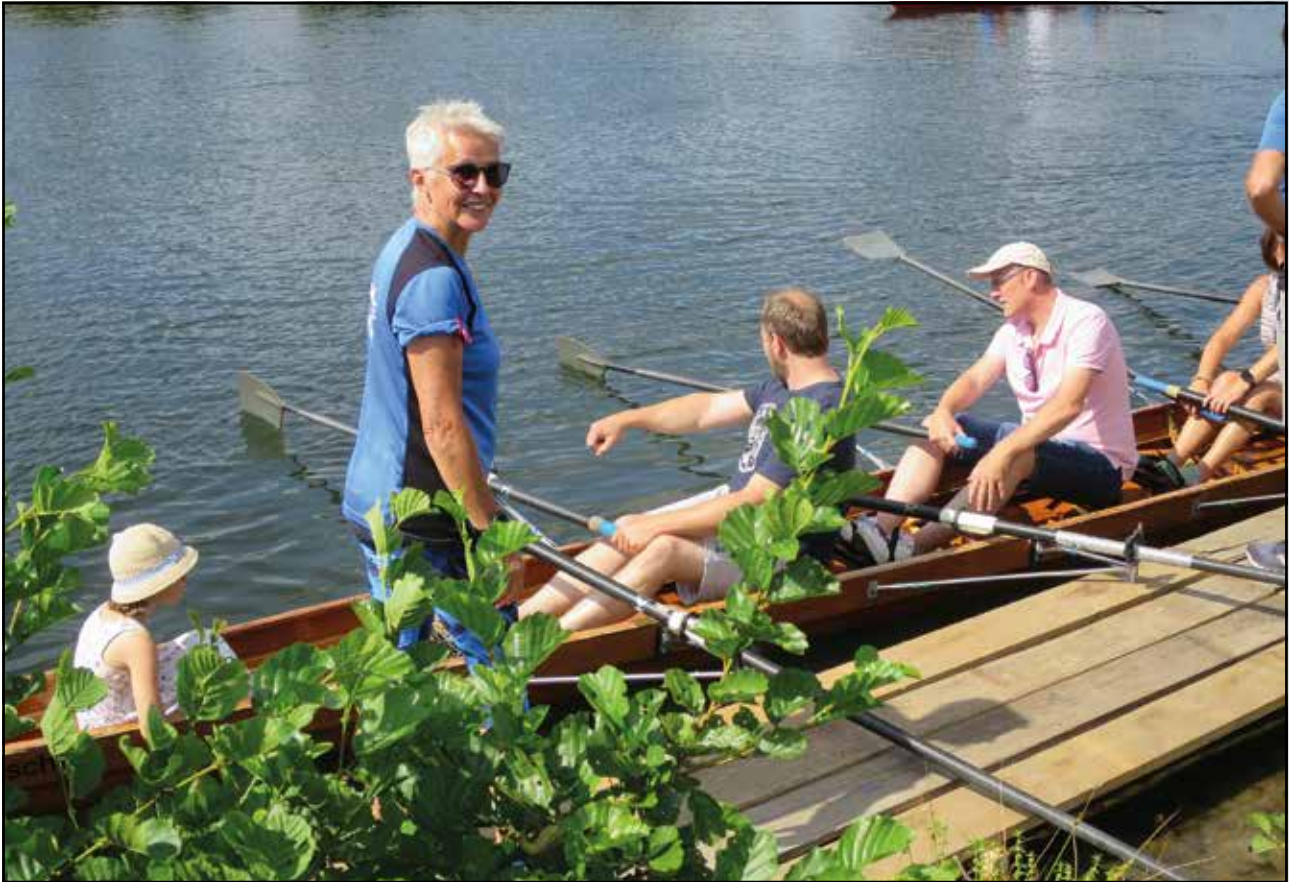
Ein besonderes Ruderangebot der Masters ...