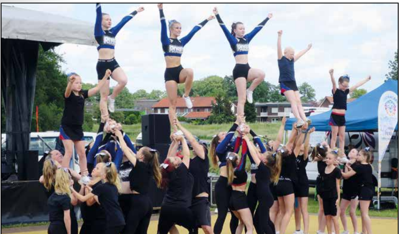
Unsere Cheerleader beim Stadtfest „925 Jahre Bramsche“

Ein gemeinsamer Auftritt am Kursende nach den Herbstferien soll ein Highlight dieser Kindertanzkurse werden. Wir hoffen, dass wir dieses tolle Angebot wiederholen können!