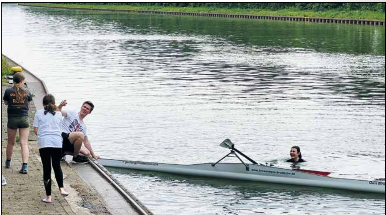
Auch das Reinformen will geübt sein.