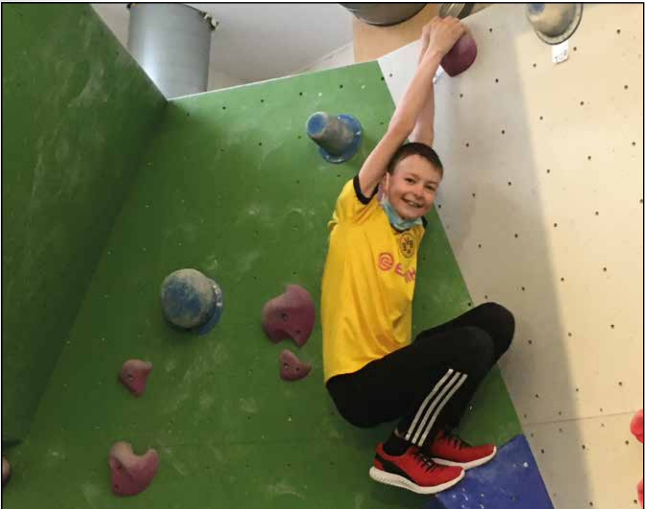
Bouldern macht fast so viel Spaß wie Rudern!

Das Training für Jugendliche richtet sich nach den Trainingszeiten der Ruderriege des Greselius-Gymnasiums Bramsche.