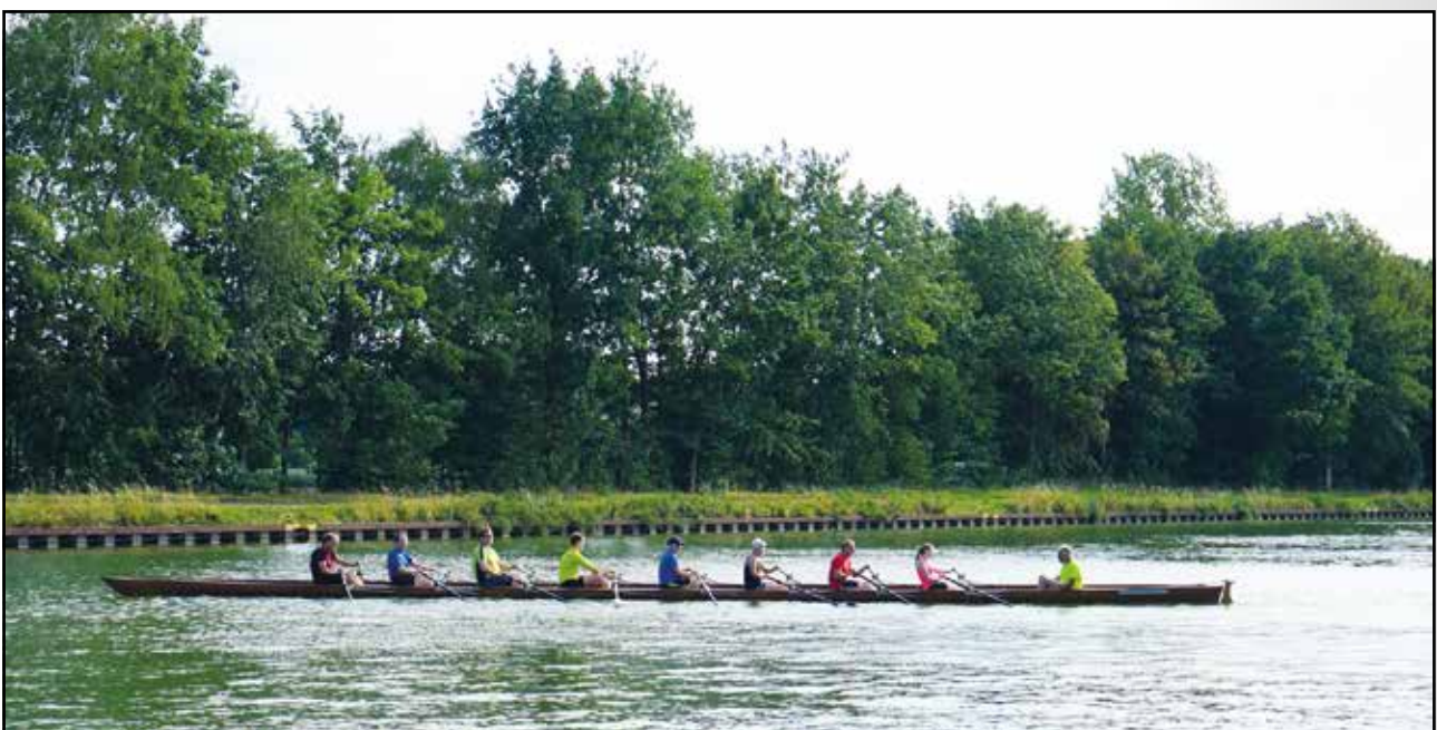
Ausfahrt im Achter