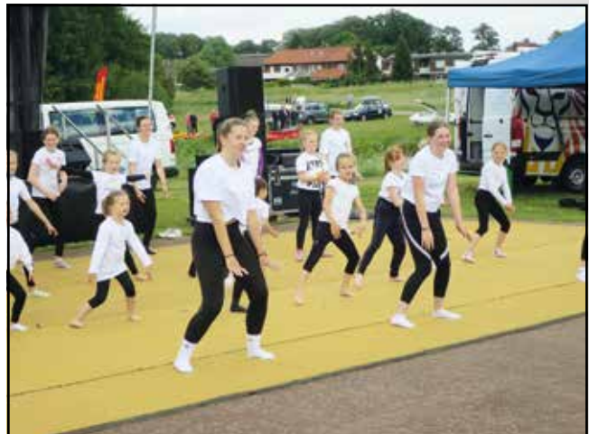
Aufwärmgymnastik der Turnerinnen