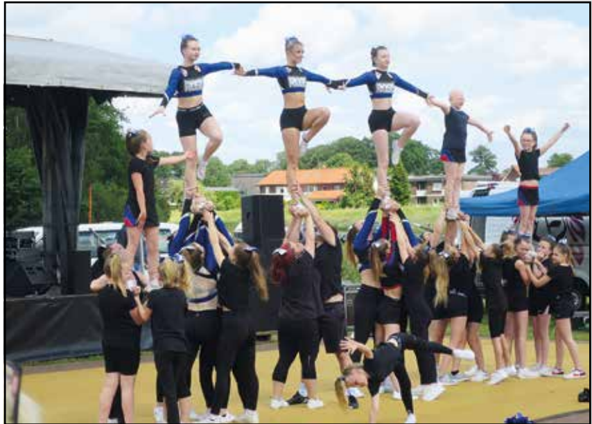
Wagemutige Cheerleader ...