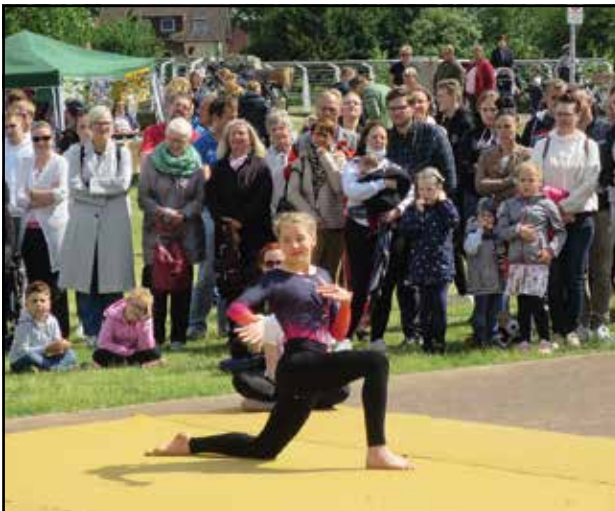
... vor großem Publikum