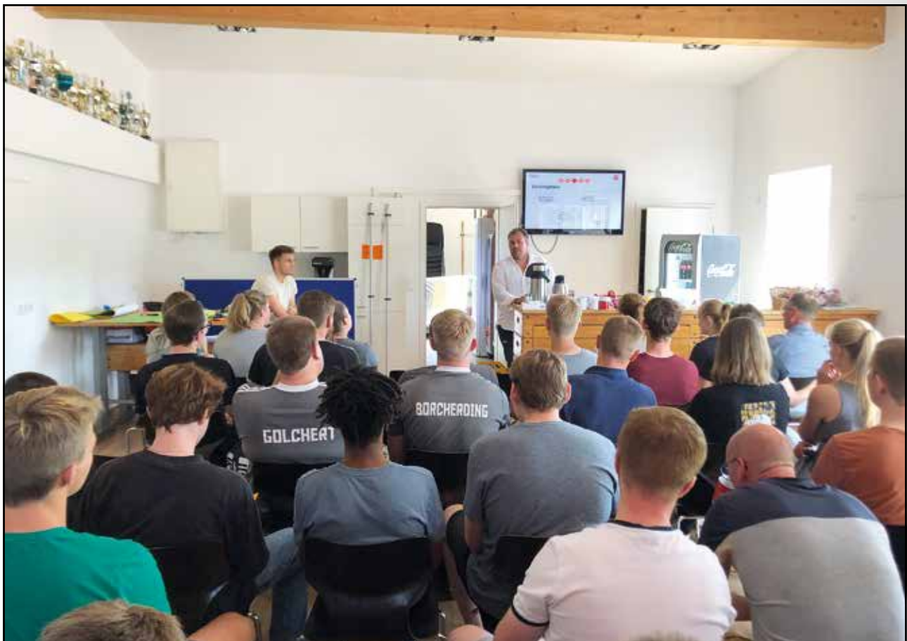
Ein Blick in die Zukunftswerkstatt der Handballabteilung

Dieser Vorschlag wurde launig und einprägsam sogleich unter dem Arbeitstitel „Rabaukenfahrt“ festgehalten. Um diese und die weiteren gemeinsam erarbeiteten Ideen zeitnah anzugehen und entsprechende Arbeitsgruppen zu bilden, wird der Abteilungsvorstand zu einer weiteren Zukunftswerkstatt einladen. Tussi hoi!