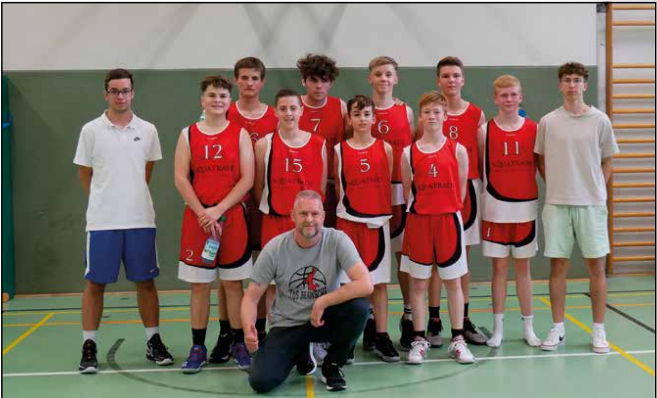
Die U16 in Leer