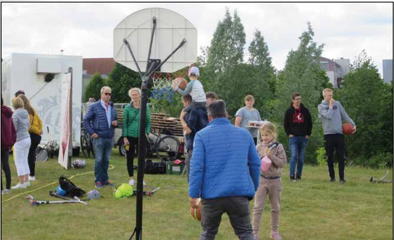
Basketballkorb als Herausforderung auf dem Stadtfest