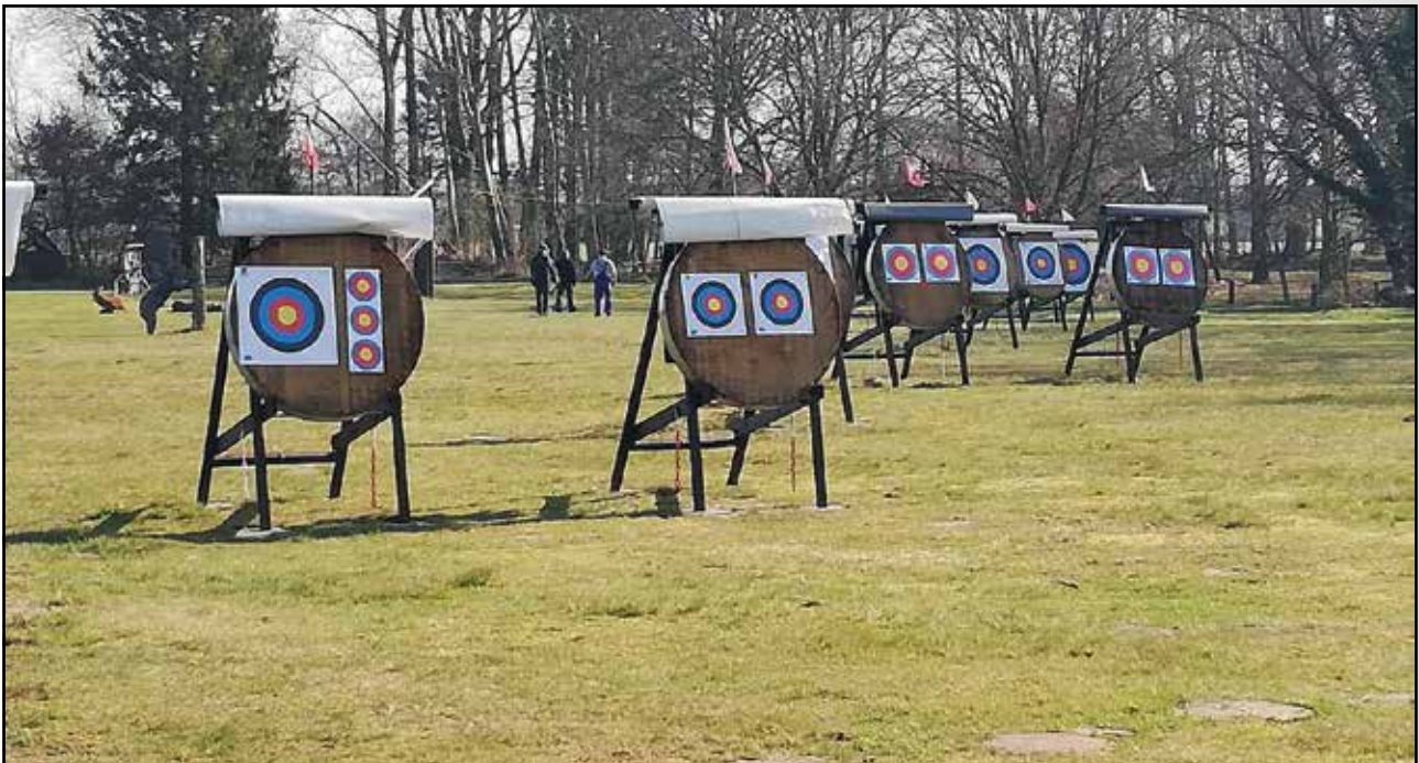
Unser Außengelände bei bestem Wetter