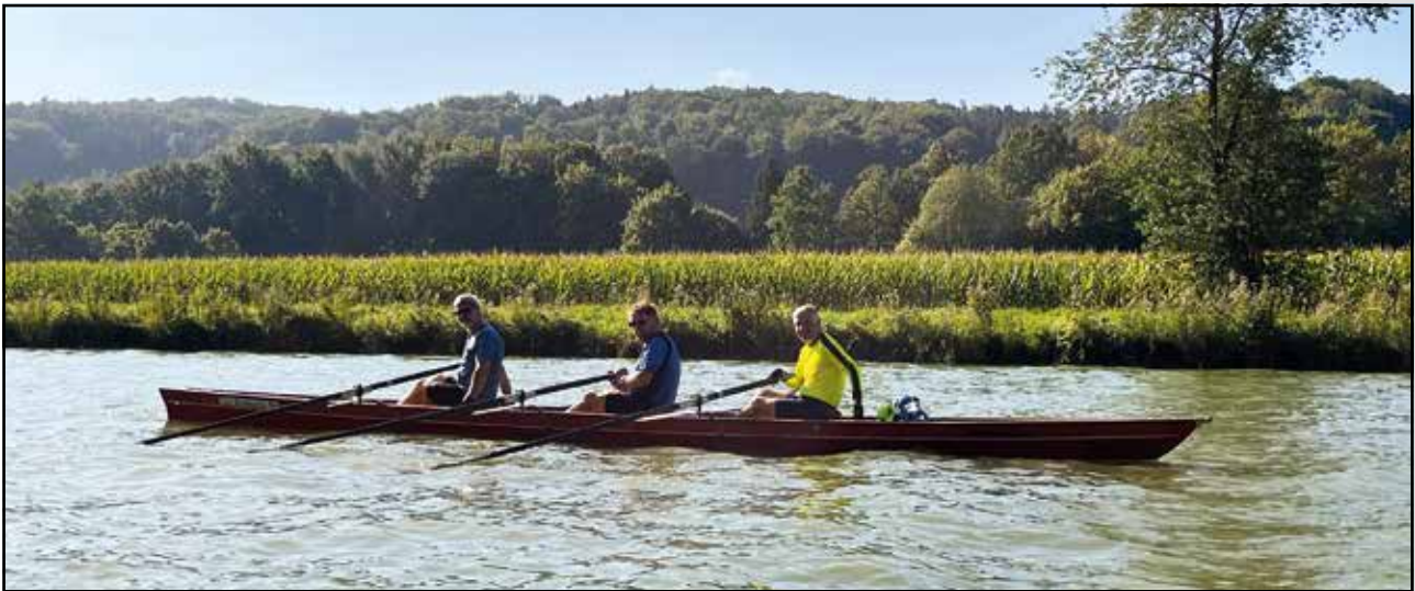
Auf der Fahrt nach Bad Essen