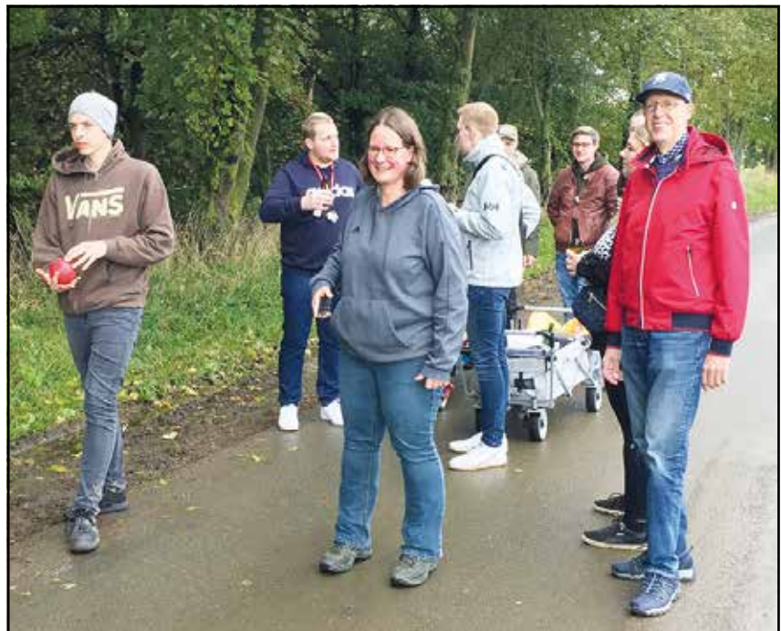
Trockenen Hauptes gut gelaunt unterwegs ...