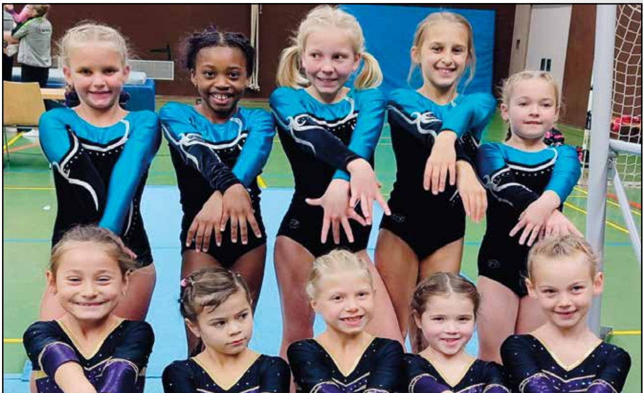
Platz 2 und Platz 3 für unsere Jüngsten! Bravo!