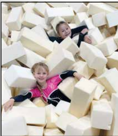
Viel Spaß am Rande der Landesmeisterschaften ...