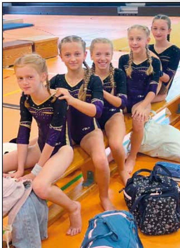
In der G2/G3 starteten zwei Mannschaften aus Bramsche/Engter.