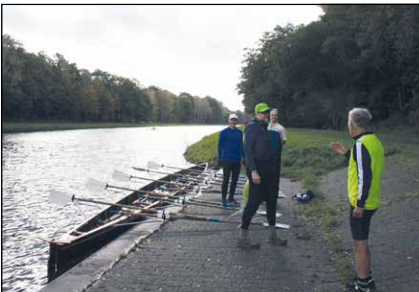
Anleger am Zweigkanal beim Abrudern