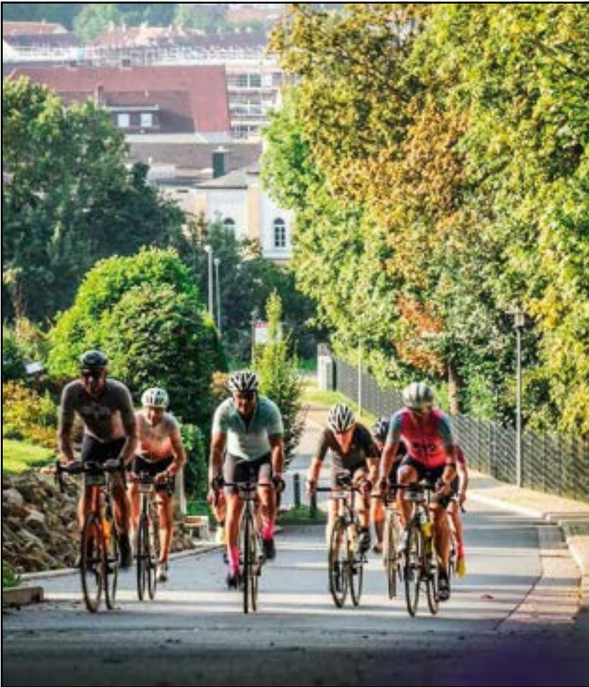
Es geht gemeinsam bergauf,