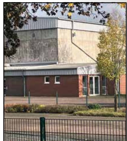
Mehrzweckraum des TuS an der Malgartener Str. 54

Der Vorstand hofft, dass wir am Ende gemeinsam eine gute Lösung finden und eine neue Sportart im TuS etablieren können. Dass auch im Vereinsheim der Bogensport-Abteilung gern „gedartet“ wird, ist davon unabhängig.