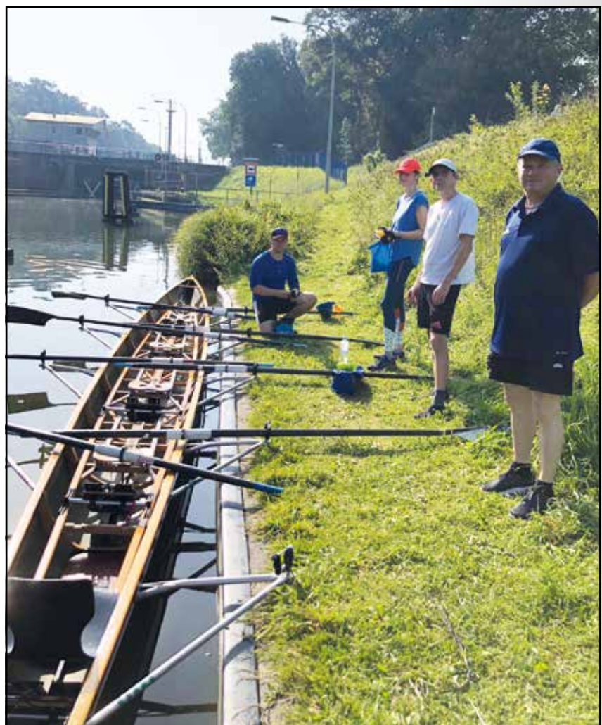
Am Anleger an der Hollager Schleuse