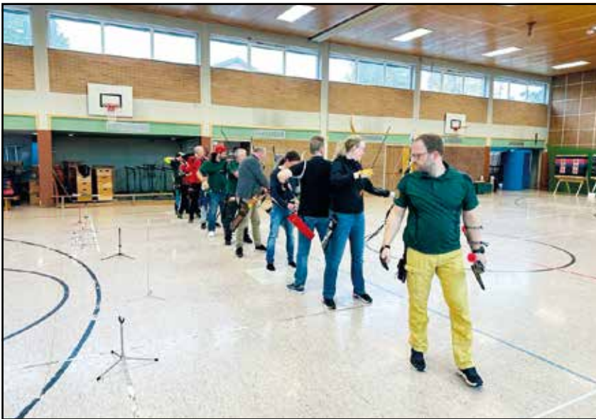
Die Vereins- und Kreismeisterschaft in allen Altersklassen

Zusätzlich stand das 3-D-Turnier in Heeke auf dem Programm.