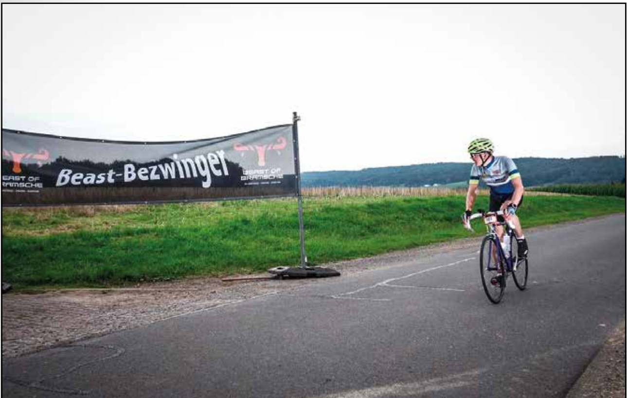
... wird man „Beast-Bezwinger“. Herzlichen Glückwunsch und auf ein Neues!