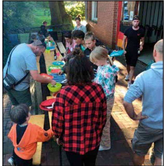
... beim Abschlussgrillen am Bootshaus