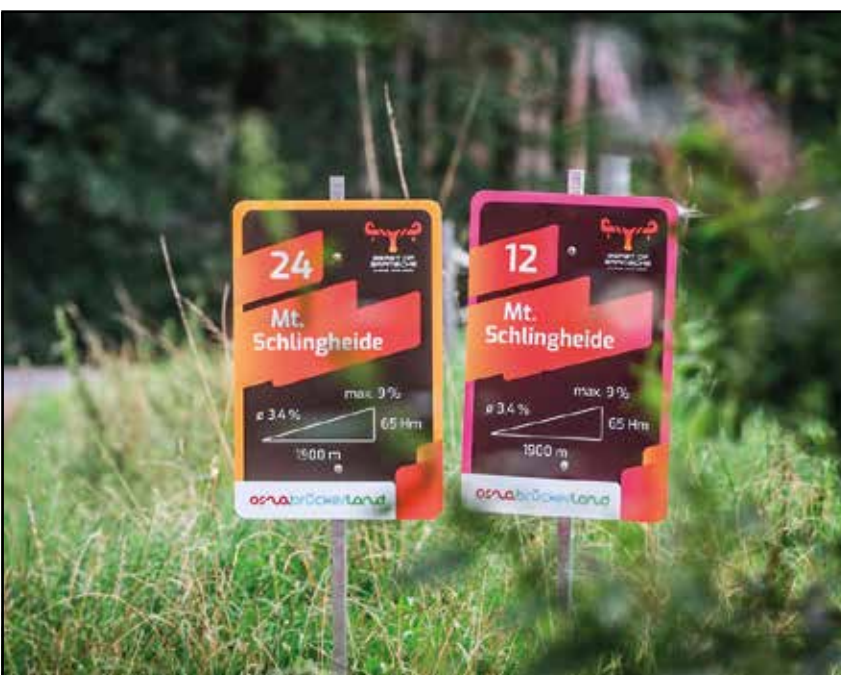
dabei stets gut informiert, wie es weitergeht.

Die Teilnehmerzahl ist im Jahr 2024 auf 400 limitiert. Anmeldestart ist der 15. Dezember 2024, bis zum 31.01.2024 heißt es: „Der frühe Vogel fängt den Fisch“.