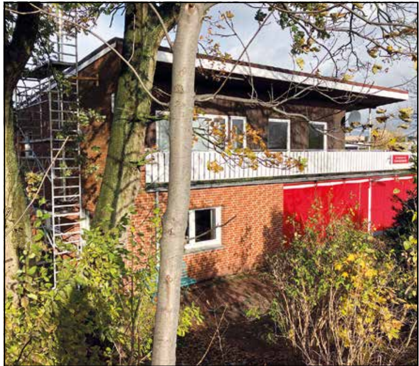
Das Kanu-Bootshaus am Mittellandkanal

Wir freuen uns bei diesem Projekt über tatkräftige Hilfe eines Sponsors, die schon zugesagt ist!