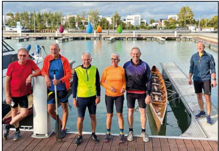
In der Marina in Bad Essen

Nach dem Abrudern fallen wie immer die abendlichen Rudertermine aufgrund der Dunkelheit aus. Die Rudertermine am Sonntag finden aber weiterhin statt und