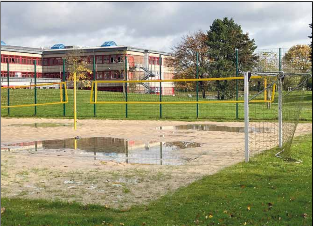
Unsere Beachanlage an der Malgartener Straße