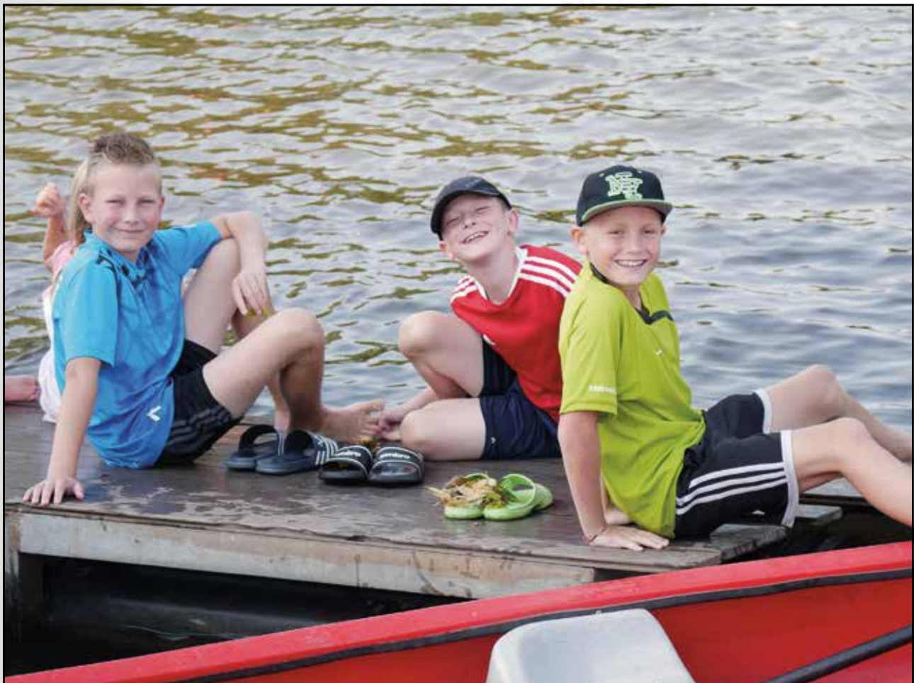
Entspannung am Wasser in Rheine

Das erfreuliche Ergebnis mündete in insgesamt 8 Medaillen. Besonders interessant war es für die jungen Kanuten, dass auch ein paar erfahrene Paddler aus dem Bereich der Erwachsenen mit an den Wettkämpfen teilgenommen haben.