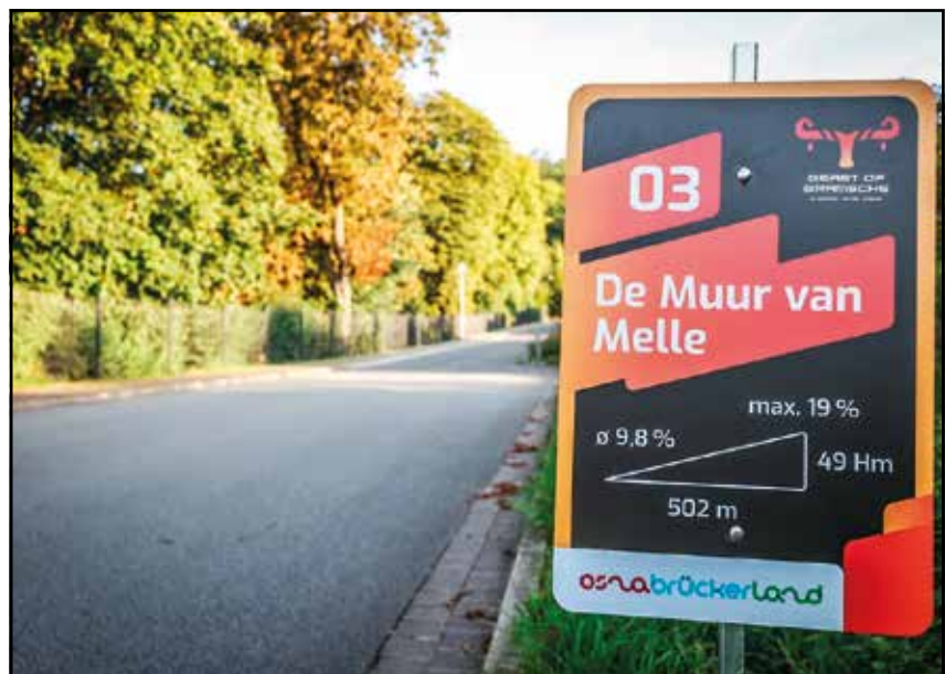
... ganz sicher aber bestens orientiert!