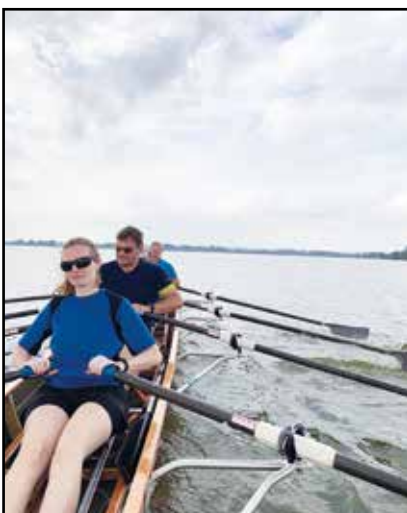
Auf dem Dümmer

Ab diesem Jahr ist es eine Wanderfahrt, bei der jeder ungezwungen so viele Runden fahren kann, wie er möchte.