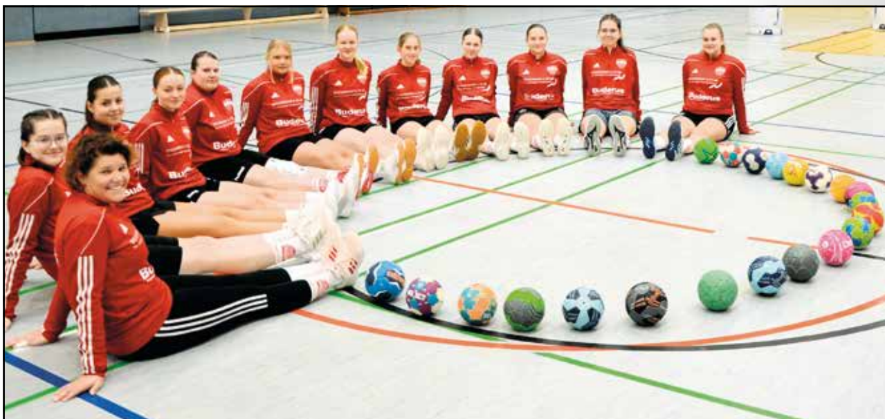
Unsere weibliche Jugend B bleibt optimistisch ...

Dazu meinen die Trainer: „Dass es gegen die Spitzenmannschaften der Oberliga wie den Northeimer HC sehr schwierig wird, war allen Beteiligten vor der Saison klar. Umso ärgerlicher ist die Niederlage bei der JSG GIW Meerhandball, wo wir einfach zu keinem Zeitpunkt in