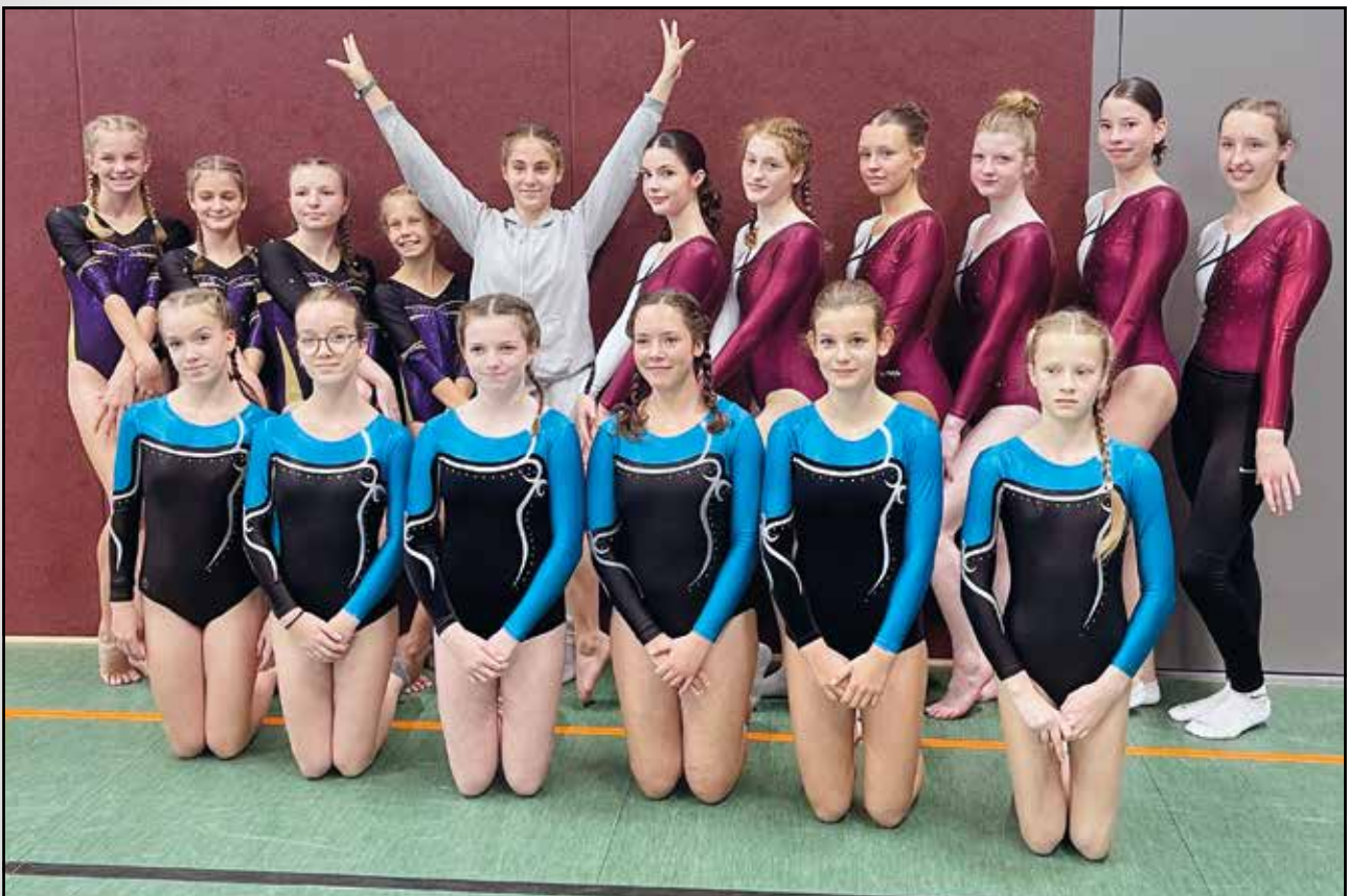
Die Kür-Turnerinnen nach einem langen Wettkampftag