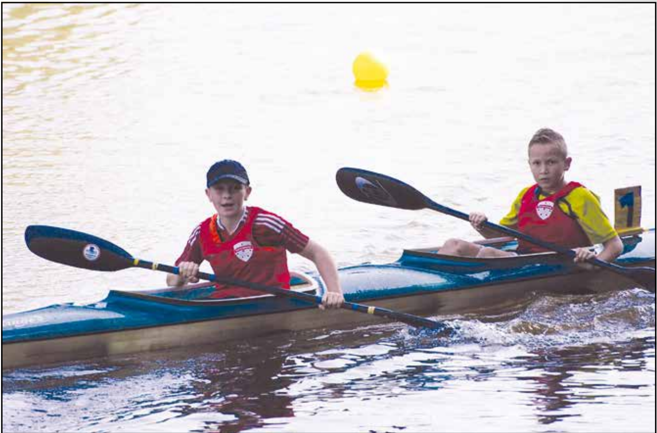
Der K2-Schüler nach dem Zieleinlauf