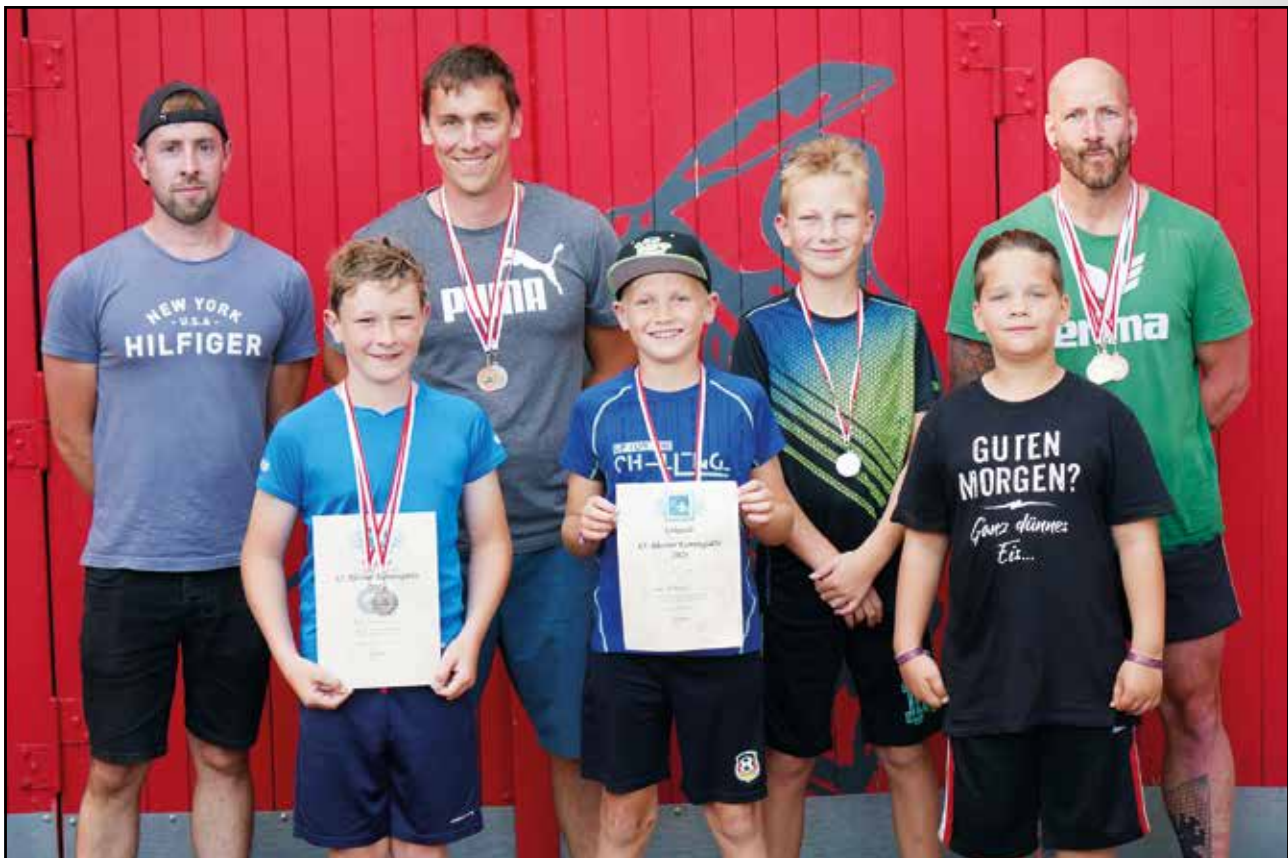
Die Preisträger aus Rheine