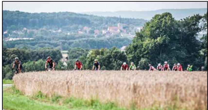
Bei hoffentlich wieder gutem Wetter ...

Damit die insgesamt 5000 verbrauchten Kalorien wieder reinkommen, richtet der TuS Bramsche vier Verpflegungspunkte an Turnhallen einrichten: Buer, Schleddehausen, Wellingholzhausen. Es wird mit einer Top-Verpflegung aufgewartet – eine warme Mahlzeit ist inbegriffen. Der Start erfolgt morgens um 06:00 Uhr in Bramsche. An 10 Anstiegen kann man die Wadenqualität besonders messen und sich dem Wettbewerb über Zeitmessungen stellen.