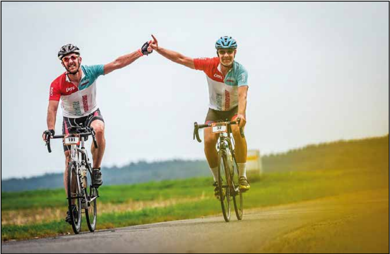
Positiv gestimmt und hochmotiviert auf landschaftlich schöner Strecke ...