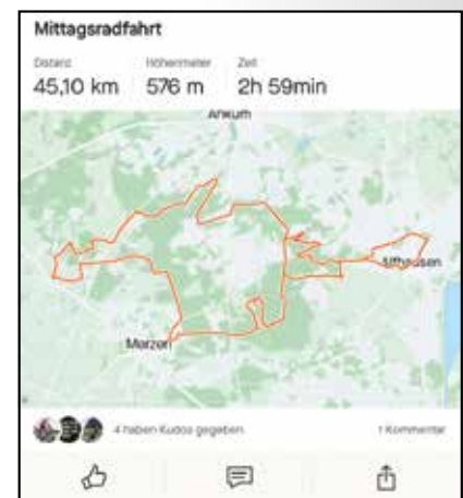
Karte zur Orientierung