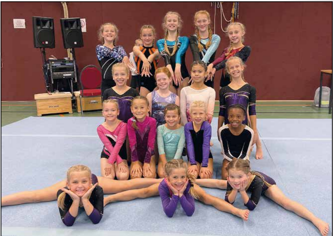
Diese 17 Turnerinnen aus Bramsche und Engter stellten sich dem großen Teilnehmerfeld in Nordhorn.