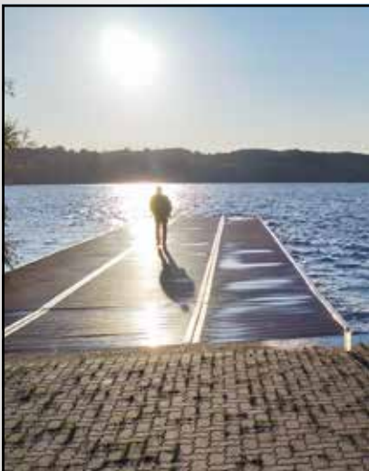
Blick auf den Ratzeburger See

Dirk und Karsten werden nach ihrer Ausbildung in Ratzeburg ab nächstem Jahr zusätzliche Rudertermine für Jugendliche anbieten und bei der Anfängerausbildung für Erwachsene mitmachen. Beim Hallentraining in diesem Winter werden sie ihre neuen Kenntnisse über Trainingspläne und Zirkeltraining einbringen.