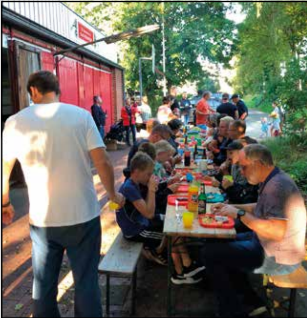
Geselliges Zusammensein ...