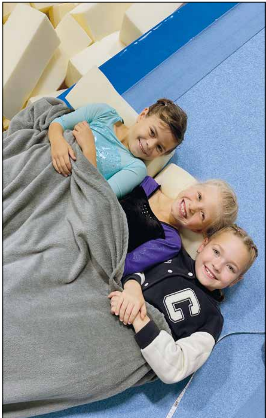
... und die Freundschaft der jungen Turnerinnen überwiegt ganz klar den Konkurrenzgedanken!

Sicherlich ein Highlight für unsere jungen Mädchen!