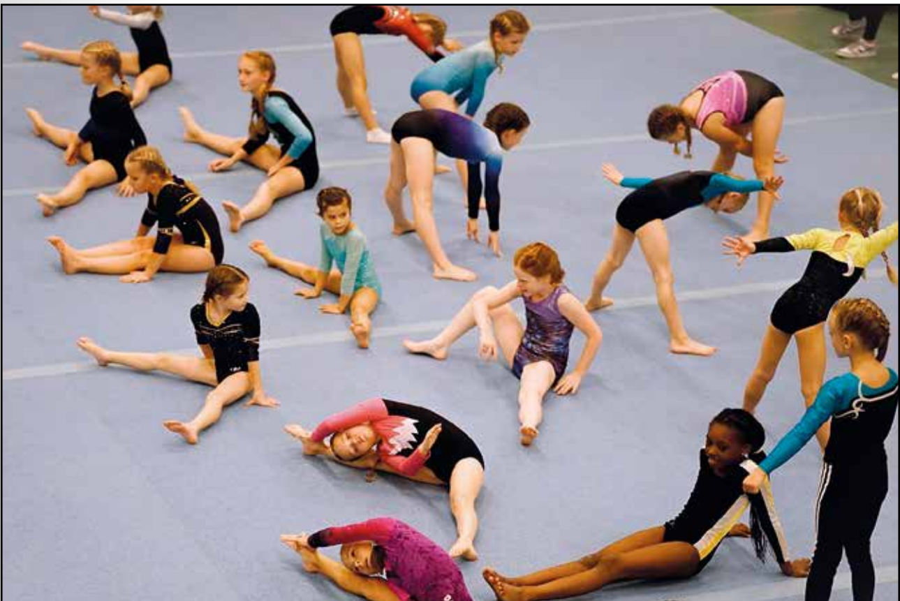
... und gemeinsame Erwärmung, bevor es ernst wurde.