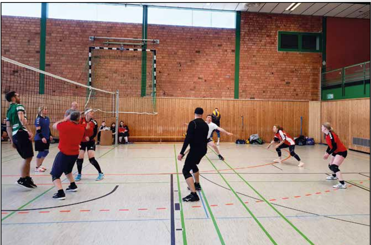
Unserer Hobby-Mixed-Mannschaft zeigt Einsatz – eine Punktspielszene aus der vergangenen Saison

Unser Hobby-Volleyball-Team spielt altersgemischt, beim Nachwuchs machen zurzeit ca. 12- bis 14-jährige Jugendliche mit.