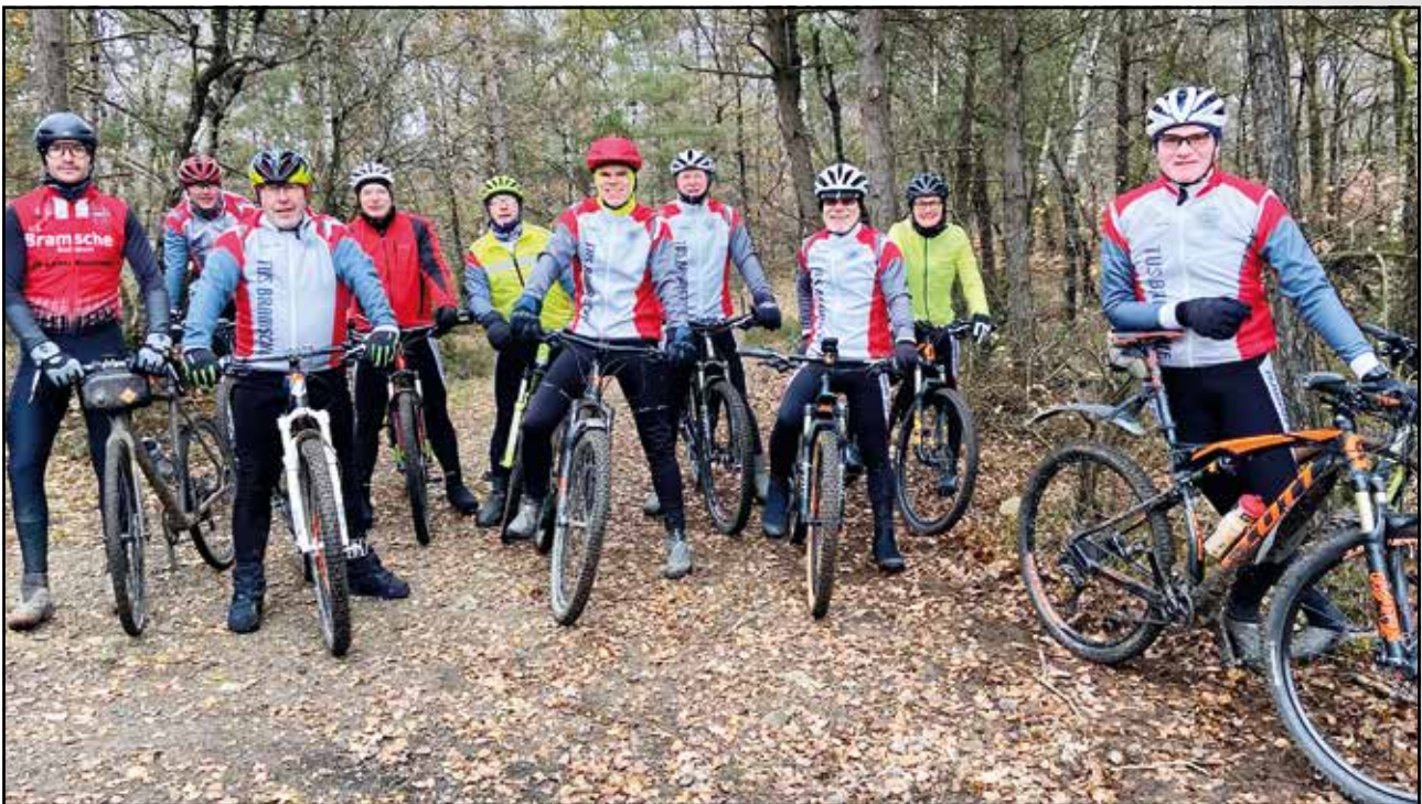
Zeit für ein Foto

wie vielen Radlerinnen und Radlern ihr ungefähr teilnehmen werdet, dann können wie die Verpflegung besser einplanen. Mail an: J.kleine.kuhlmann@t-online.de