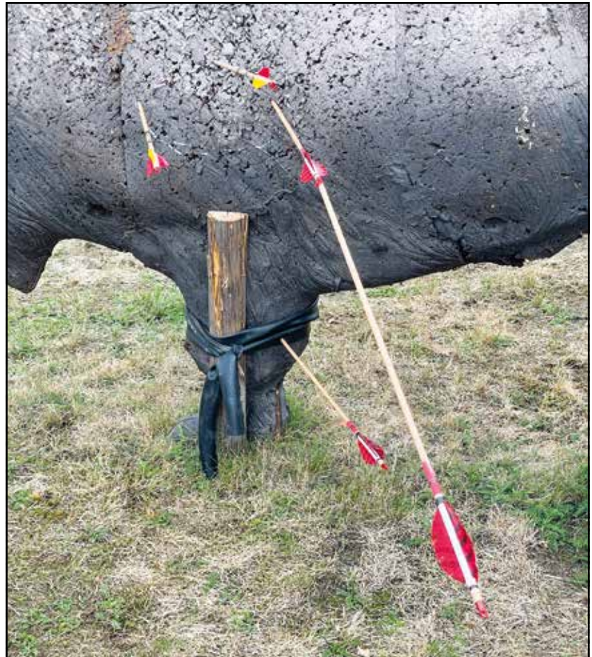
„Robin-Hood-Schuss“ beim Training von Torsten Grotkopp