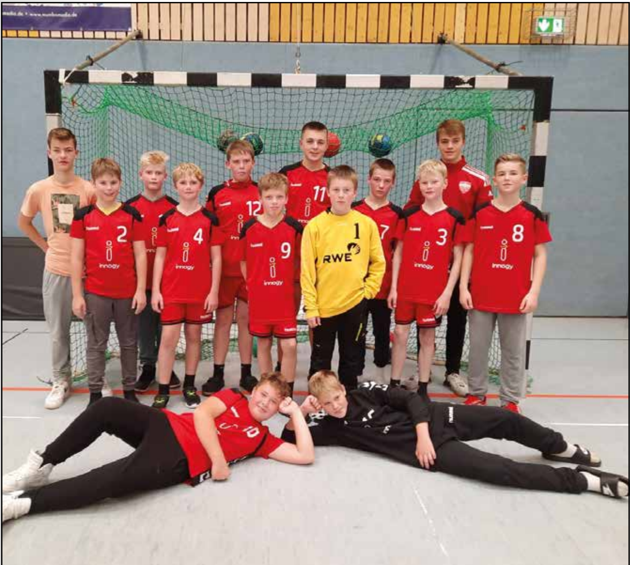
Spieler unserer männlichen D- und E-Jugend

So gehen sowohl die D- als auch die E-Jugendlichen hoch motiviert in die Zeit nach Weihnachten, wenn die Karten noch einmal völlig neu gemischt werden und neue Gegner auf uns warten.