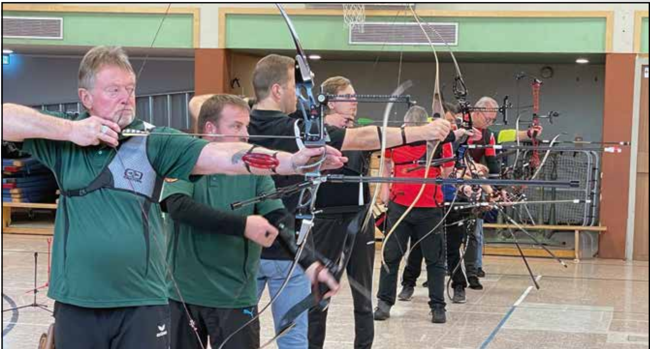
Vereins- und Kreismeisterschaft sowie Training in der Halle

tragen haben, für diese auch zugelassen werden.