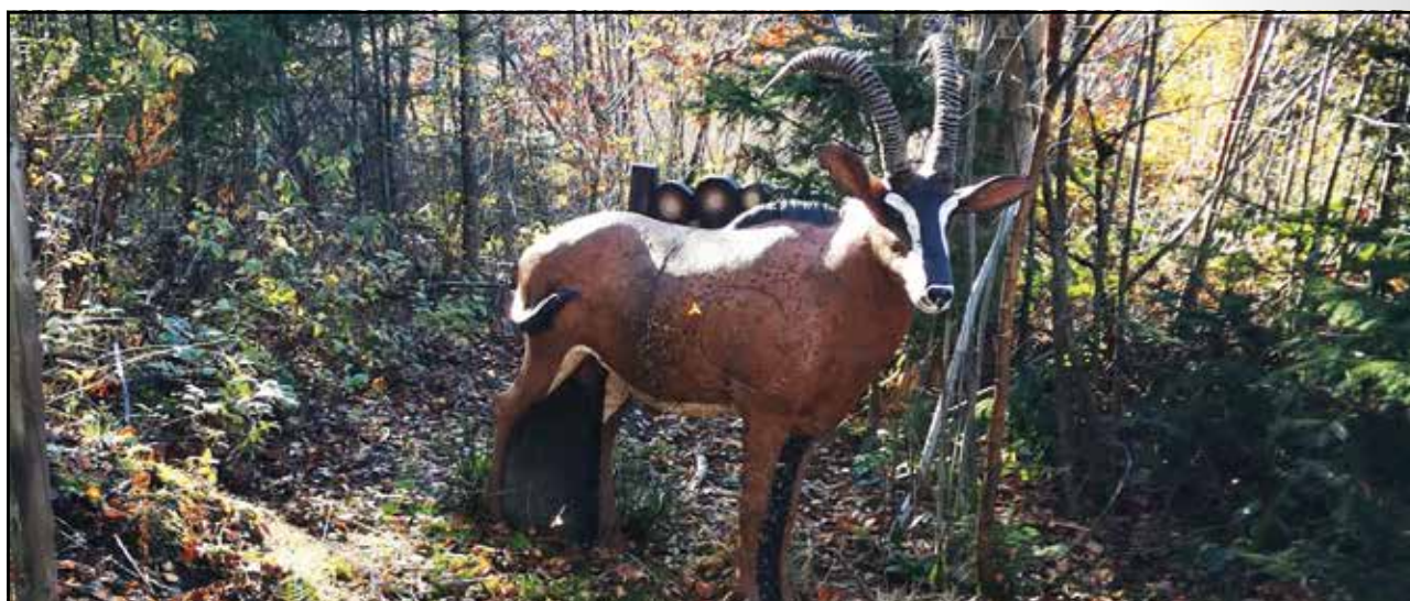
Trainingsschießen auf einem der vier Parcours in Brilon