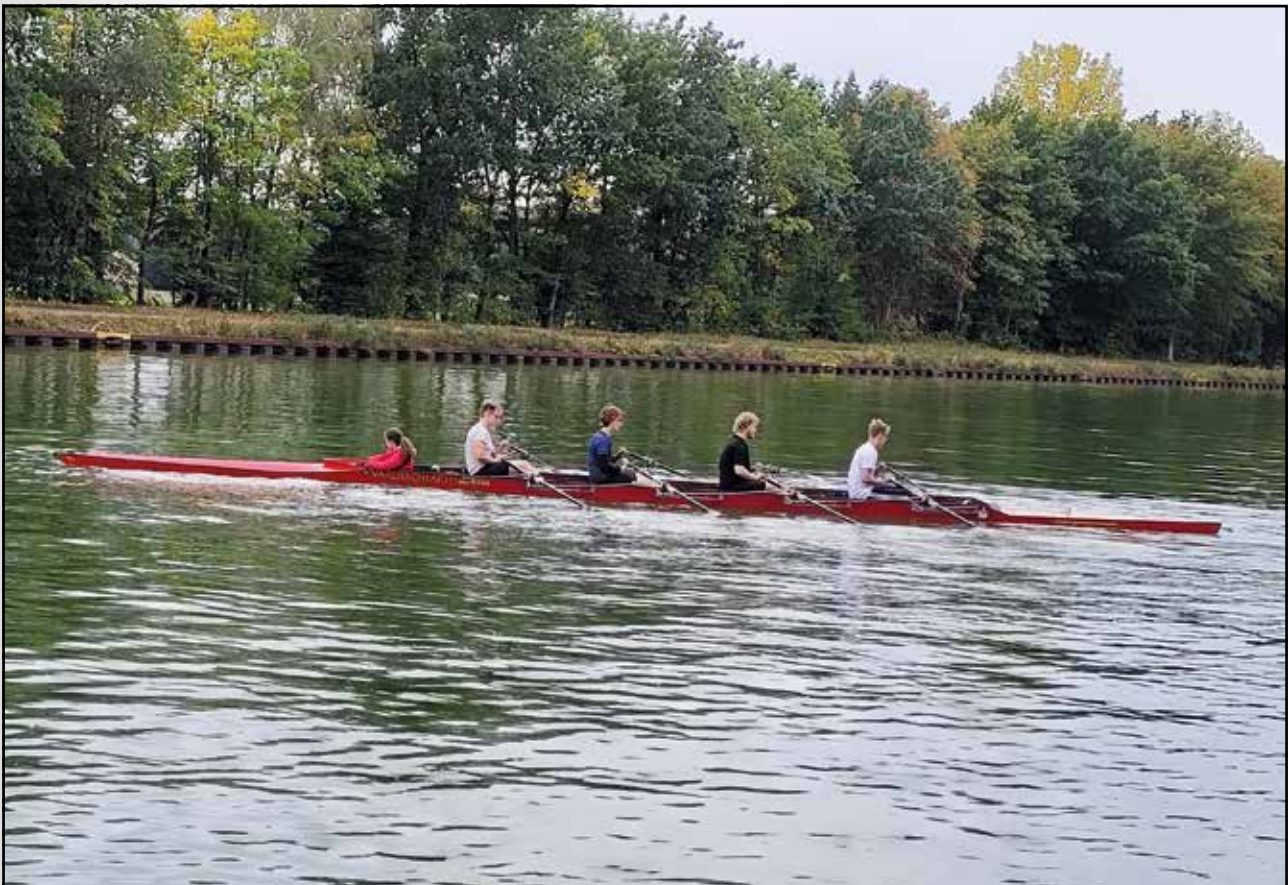
Das Junioren-Ruderteam beim Rennboot-Training

Die Jahreshauptversammlung der Vereinigung Ehemaliger Ruderer (VER) Bramsche war am 16.11.2022 um 17 Uhr im Bootshaus an der Hafenstraße terminiert.