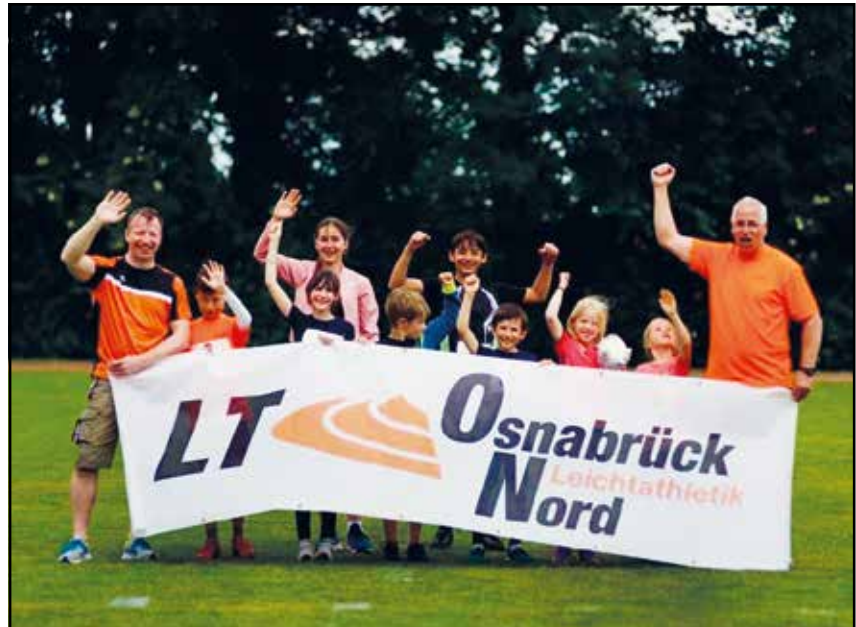
Sportfest am Schölerberg

Der Sommerwettkampf der Witte-KinderLiga im Landkreis wird mittlerweile traditionell vom LT Osnabrück-Nord ausgetragen.