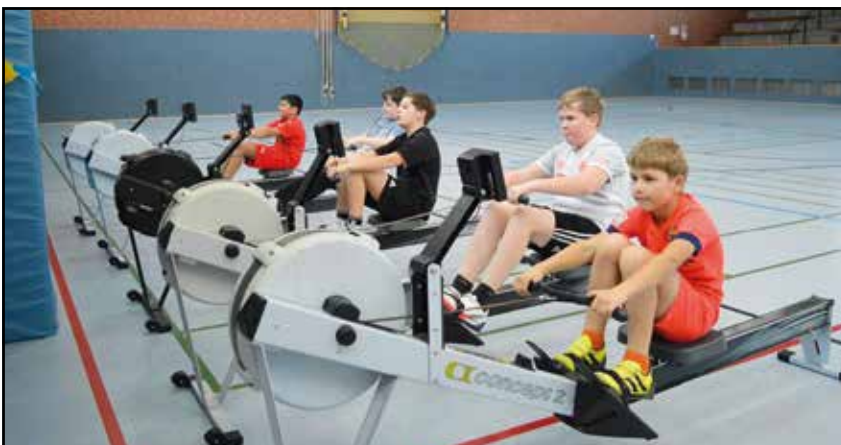
Abwechslungsreiches Hallentraining ...