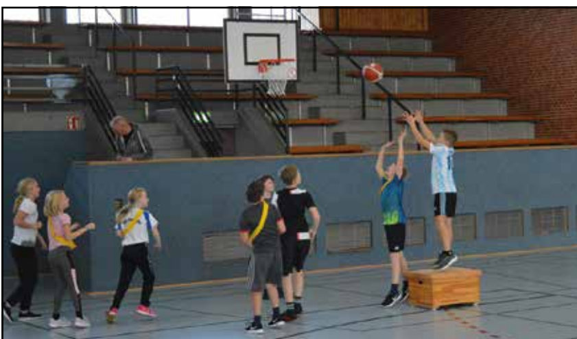
... unserer Jugendlichen in der Halle des Gymnasiums