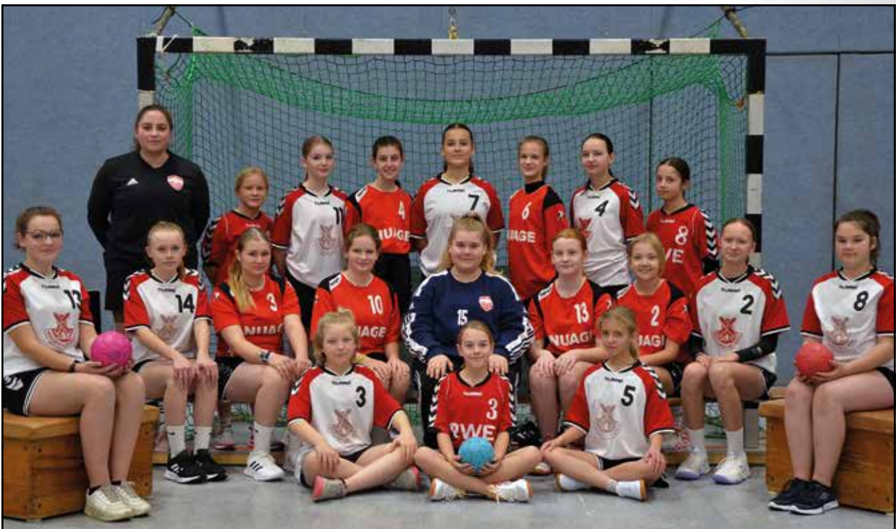
Die weibliche Jugend C des TuS

Trotz der großen Aufregung der Jungs übertraf die erste Halbzeit alle Erwartungen. Mit einer hervorragenden Mannschaftsleistung in der Abwehr sowie im Angriff konnten wir mit einer 16:12-Führung in die Pause gehen.