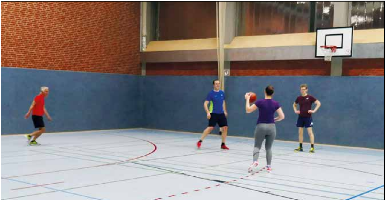
Hallentraining der Erwachsenen