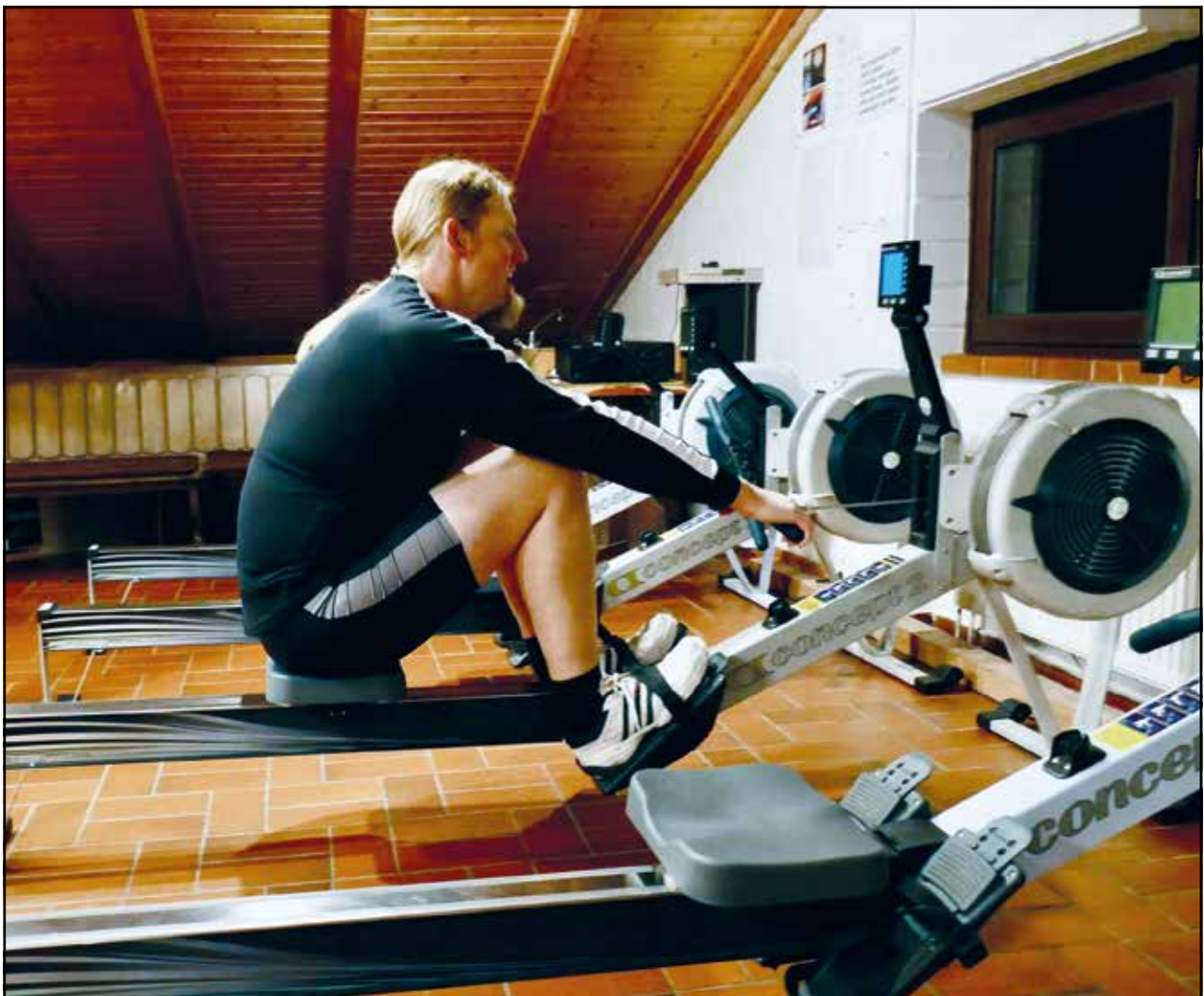
Wintertraining im Ruder-Bootshaus