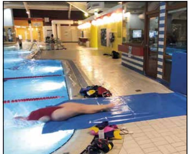
Übungsvorbereitung der Trainer