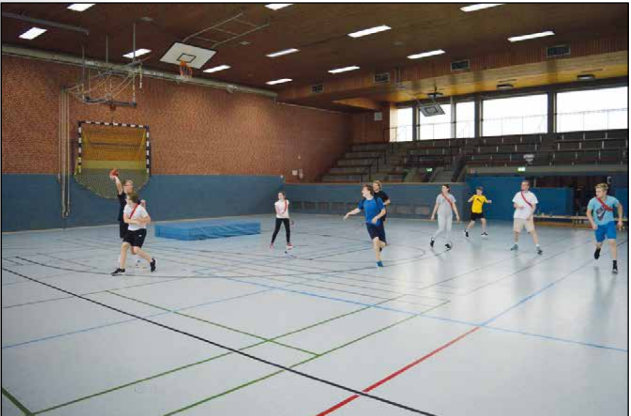
Hallentraining der Jugendlichen