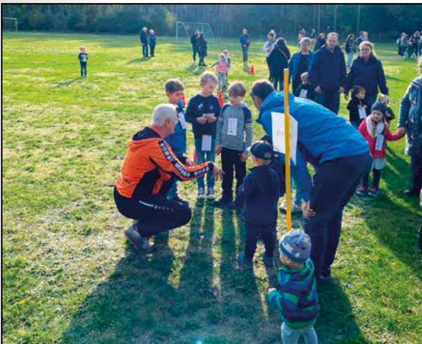
Hürdenlaufen für die Kleinsten in Pente

Neben unseren Sportkollegen vom Fußball und Judo bauten wir drei Stationen aus der Kinderleichtathletik auf. Am begehrtesten war hierbei der kleine Hindernisparcours, den die Kinder mit Begeisterung auch freiwillig mehrmals liefen.