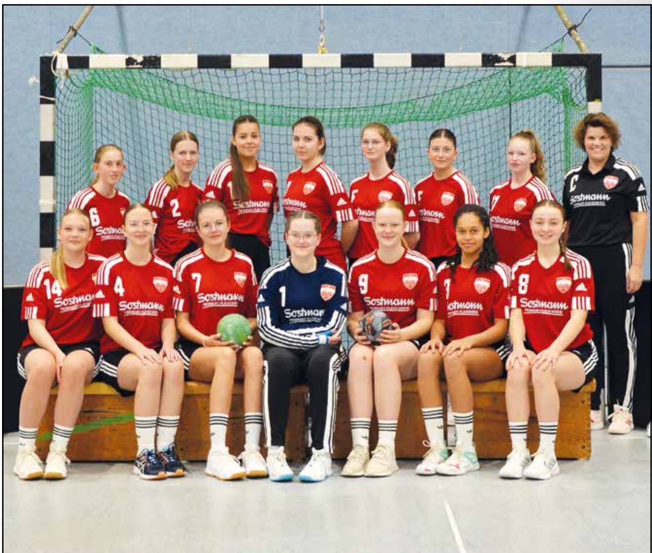
Die Landesligamannschaft des TuS in der weiblichen Jugend B